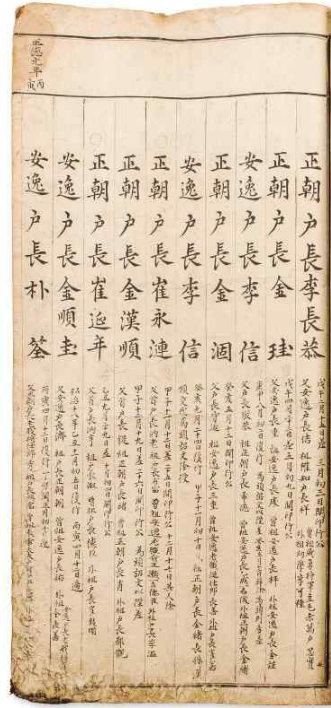
<경주부사선생안>(구안) 표지(왼)와 내지(오)