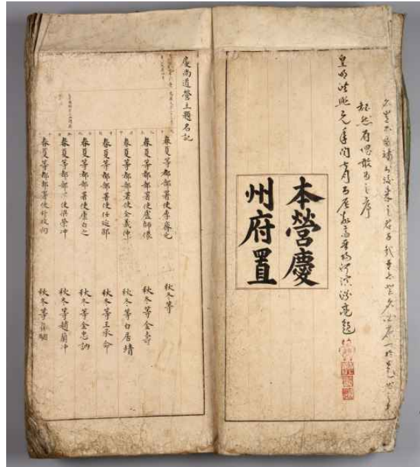
<경상도영주제명기 - 표지(왼)와 내지(오)> * 국립경주박물관 소장(표제: 당하제명기)