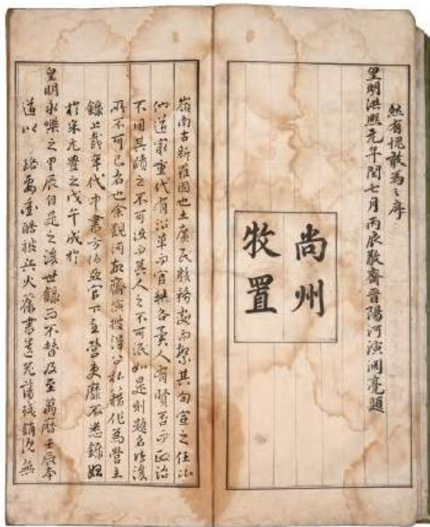
<경상도영주제명기 - 표지(왼)와 내지(오)> *상주향교 소장(표제: 도선생안)