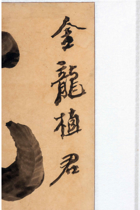
<글씨를 선물 받은 '김용식'(독립운동가 김형진의 손자)의 이름>