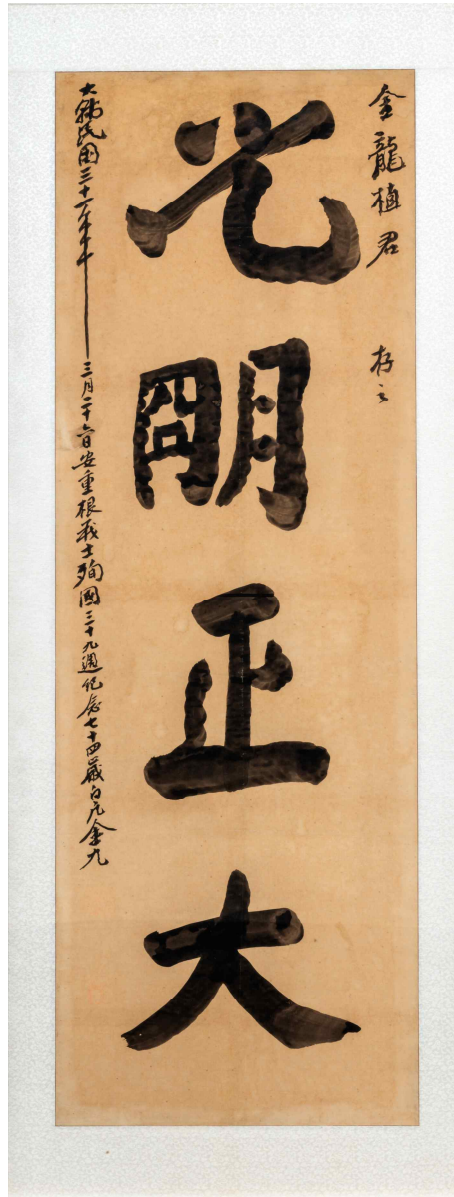
<백범 김구의 휘호 '광명정대(光明正大)'>