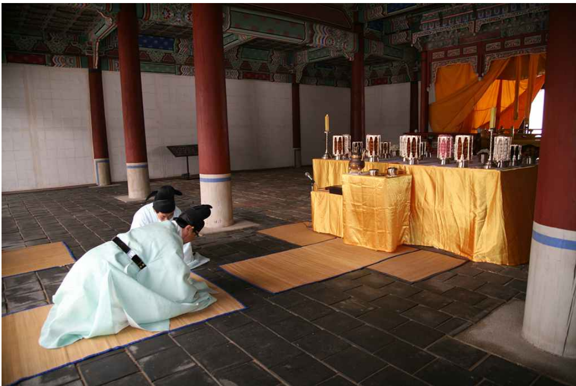
<홍릉 제향 모습 - 초헌례>