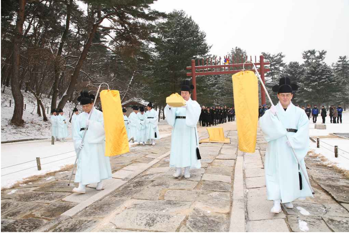
<홍릉 제향 모습 - 전향축례>