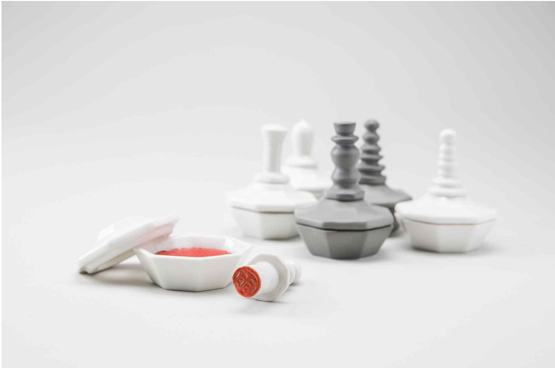
<김정우 作 - '인주·인장합'>