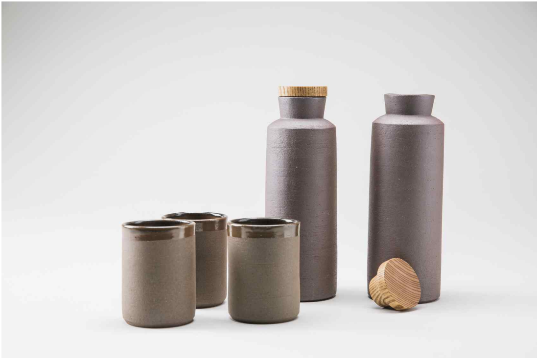
<고우리·박표진 作 - '자리 : 끼(물병, 컵)'>