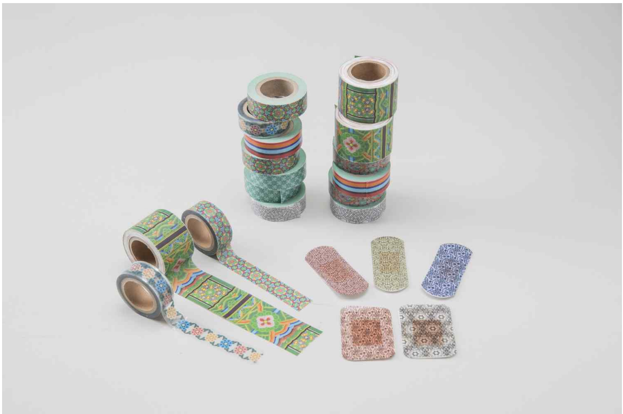
<송형우·박주희 作 - '단청띠(丹青帶)'>