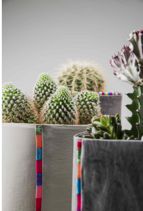
<문희원·박기찬 作 - '길상문 마포 조명(吉祥紋 麻布, 삼베, 모시)'과 '색동화분커버'>