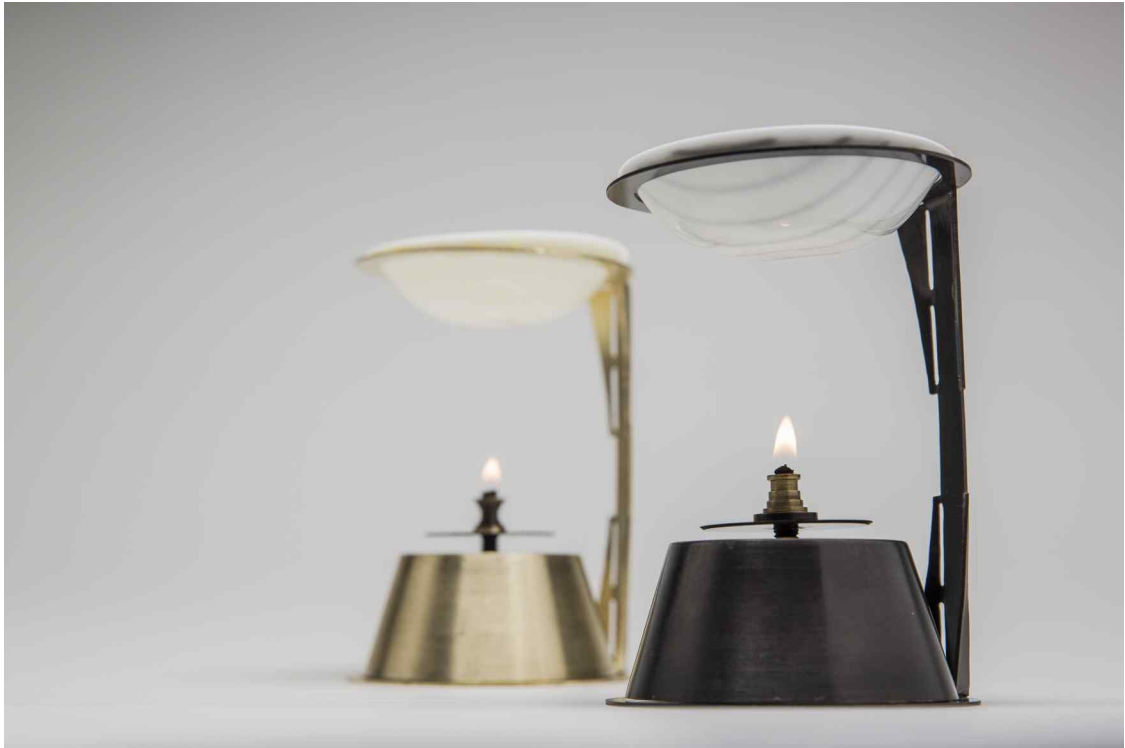
<오승환·유상욱 作 - 'c-thru ho long(아로마 오일 워머)'>