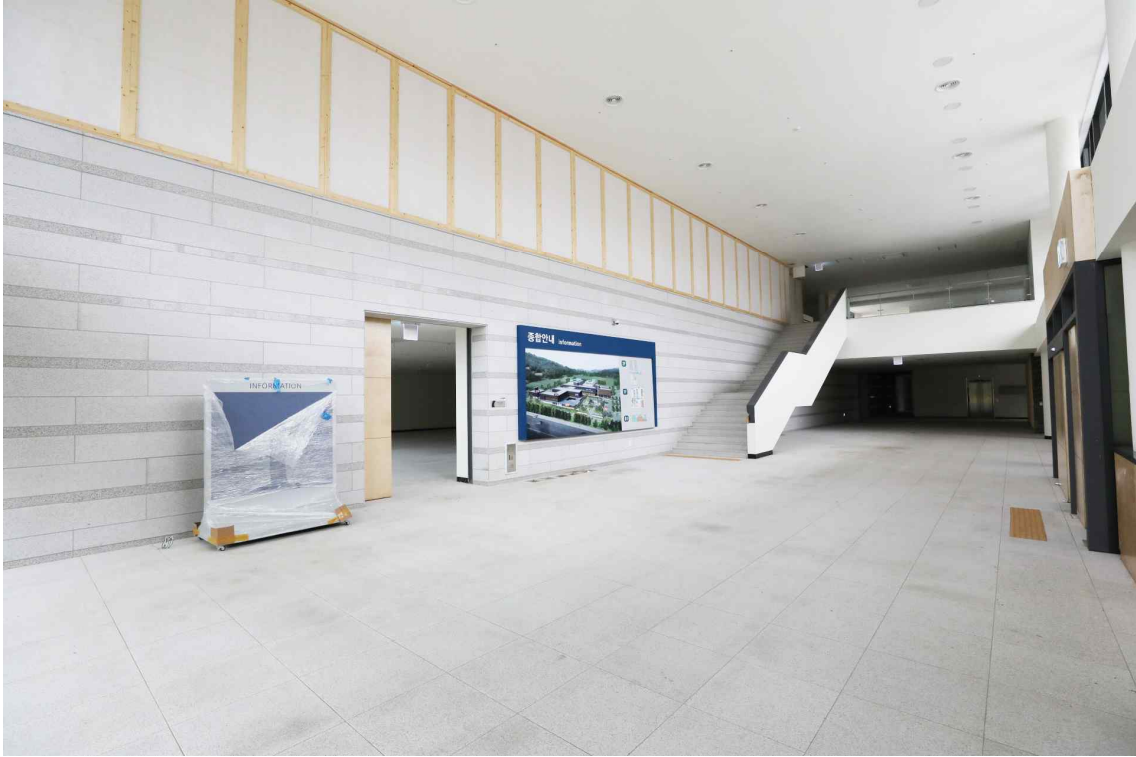
<건물 로비와 전시관 입구>