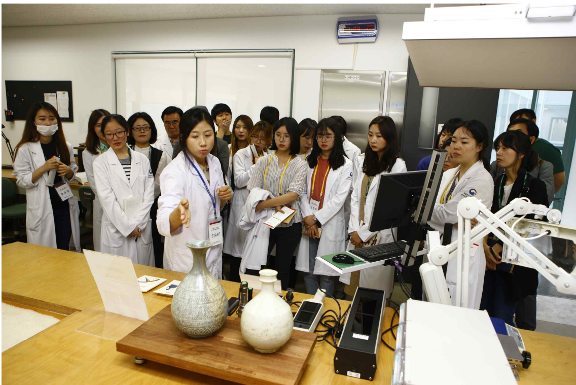
<2017 생생(生生) 보존처리 데이(DAY) 현장>