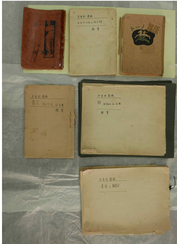
<윤동주 친필 원고>