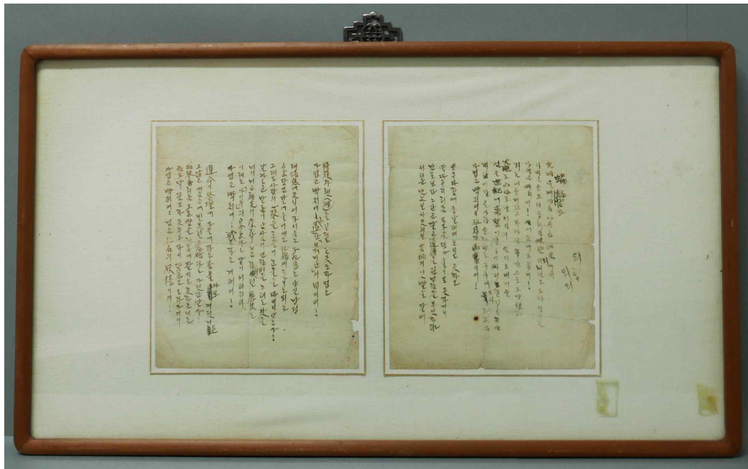
<「이육사 친필원고 '편복(蝙蝠)」>