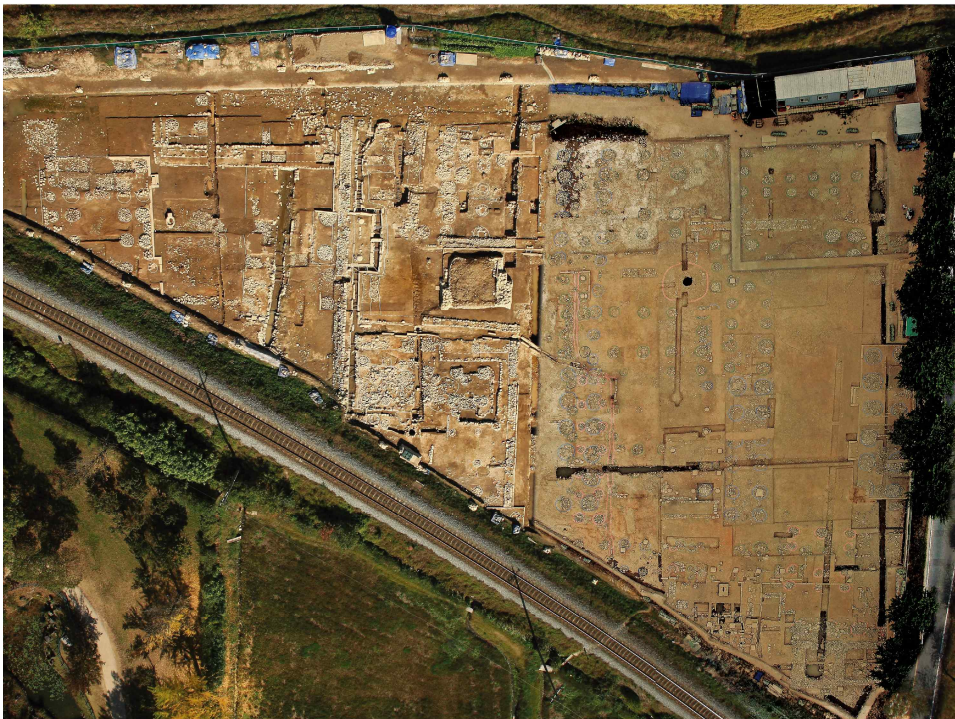
<경주 동궁과 월지 '가'지구 유구현황>