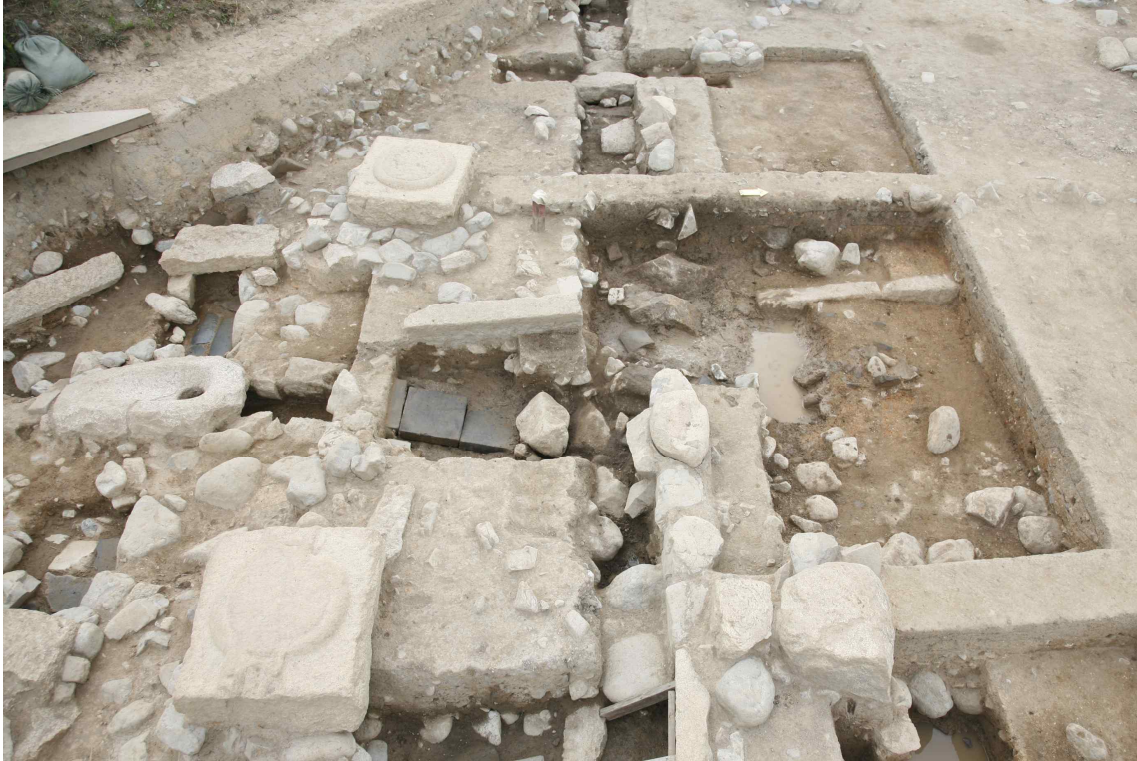
<변기 시설과 배수시설 연결 모습>