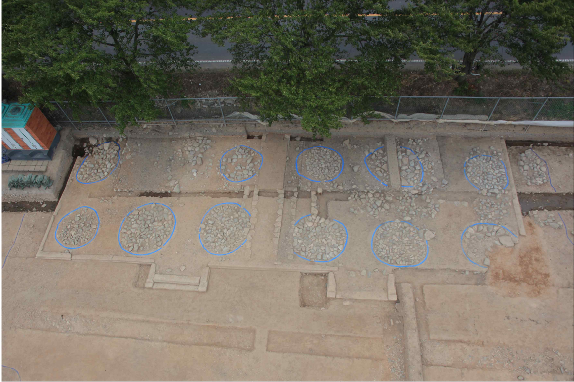
<동문 추정 대형건물지>