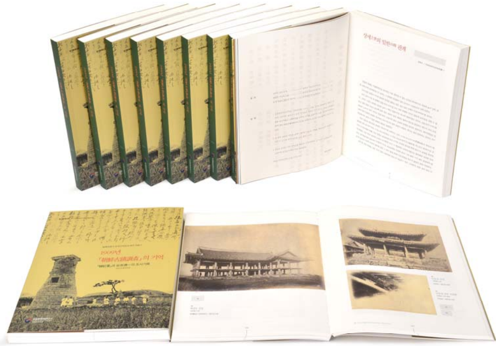
< 『1909년 朝鮮古蹟調査의 기억』 내지 >