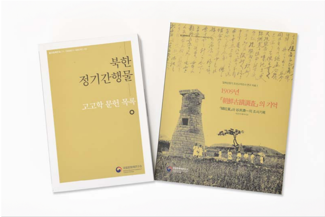
< 『북한 정기간행물 고고학 문헌 목록』 (좌), 『1909년 朝鮮古蹟調査의 기억』 (우)>