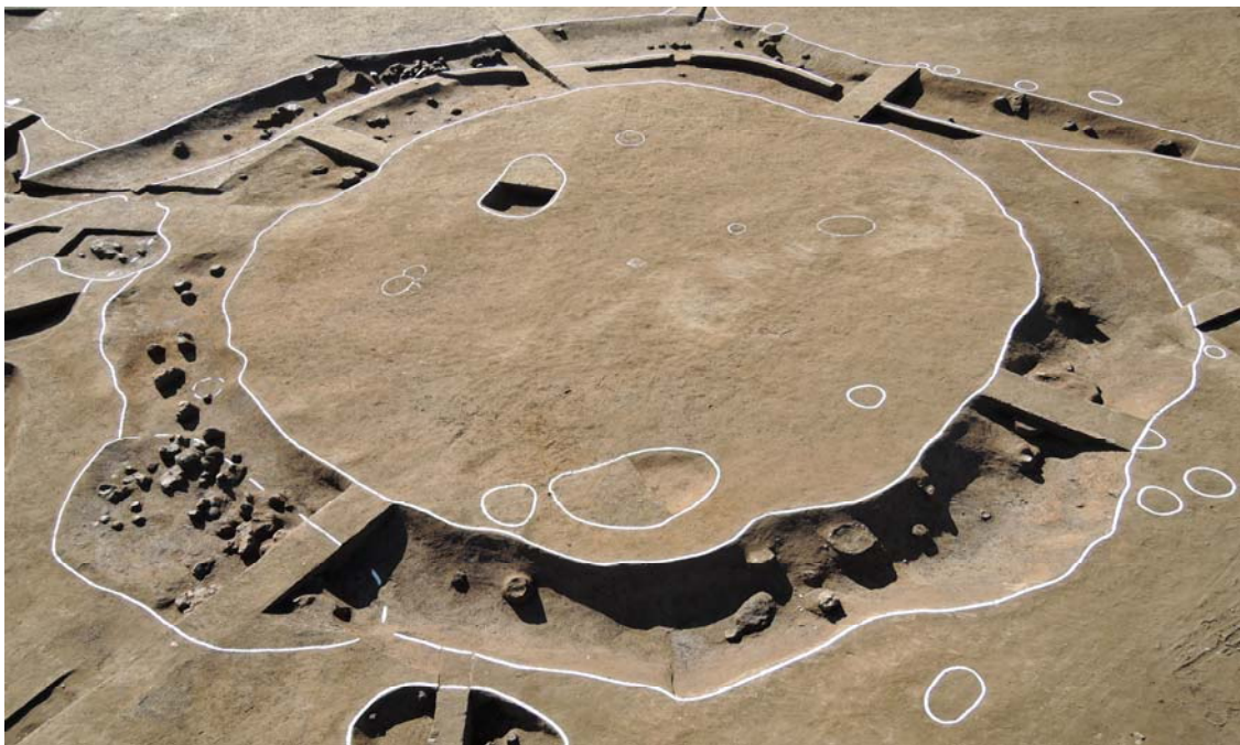
<외부구가 둘러진 방형건물지: I-③구역, 호남문화재연구원>