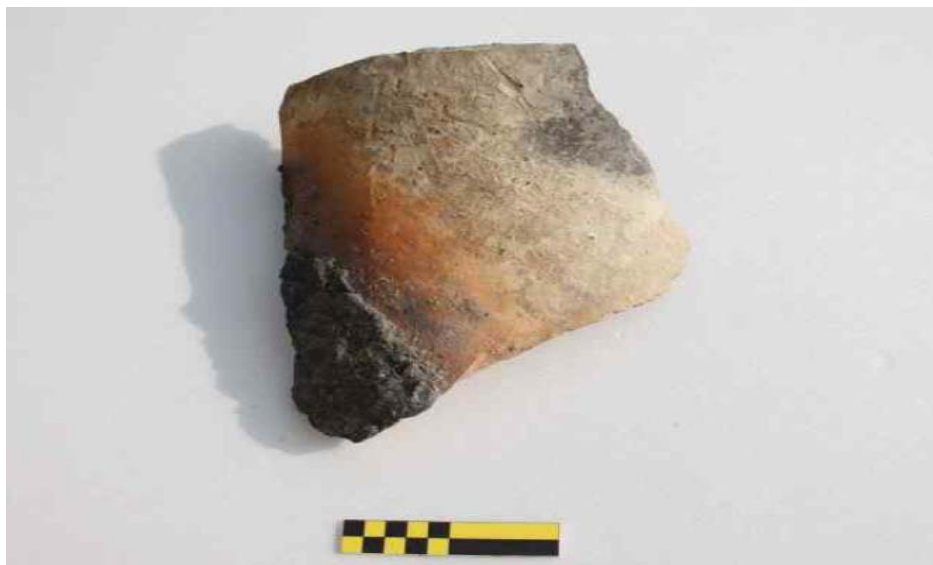
<송풍관 조각: I 지점, 동아세아문화재연구원>