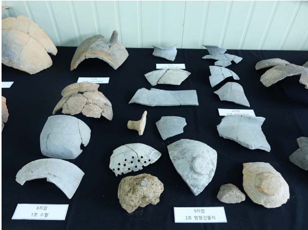
<건물지 및 수혈유구 출토유물>