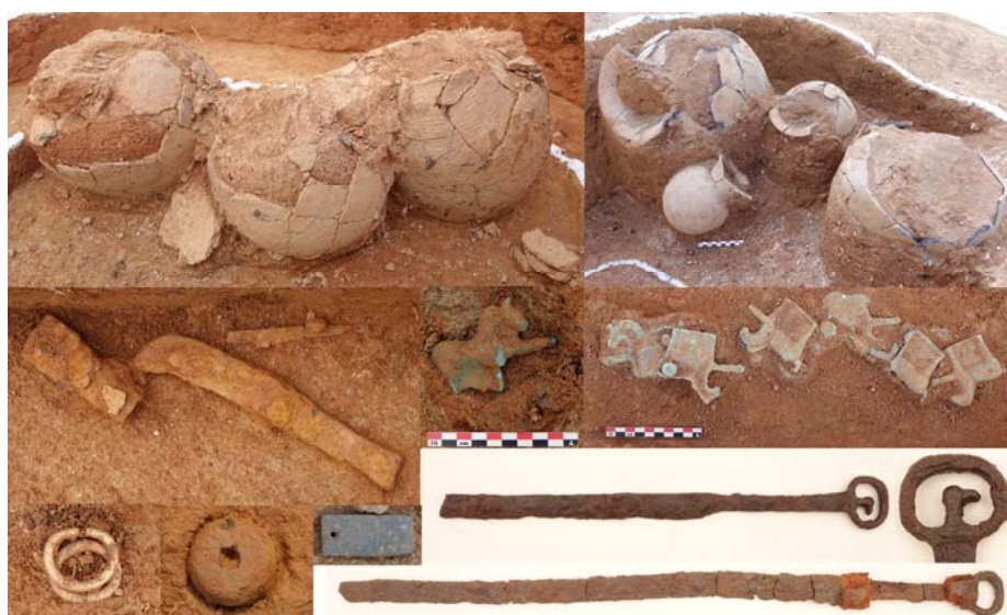
<삼국 시대 토광묘(위)와 출토유물(아래) 모습: II-②구역, 중부고고학연구소>