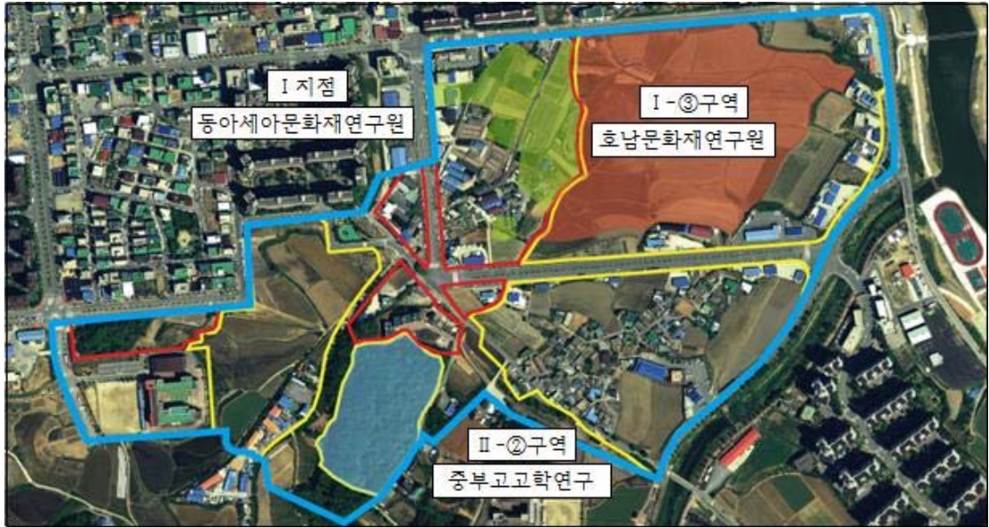
<아산 배방월천지구 도시개발사업부지 내 문화유적 발굴조사 범위>