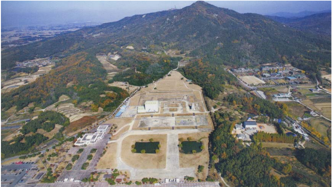
<익산 미륵사지 전경>