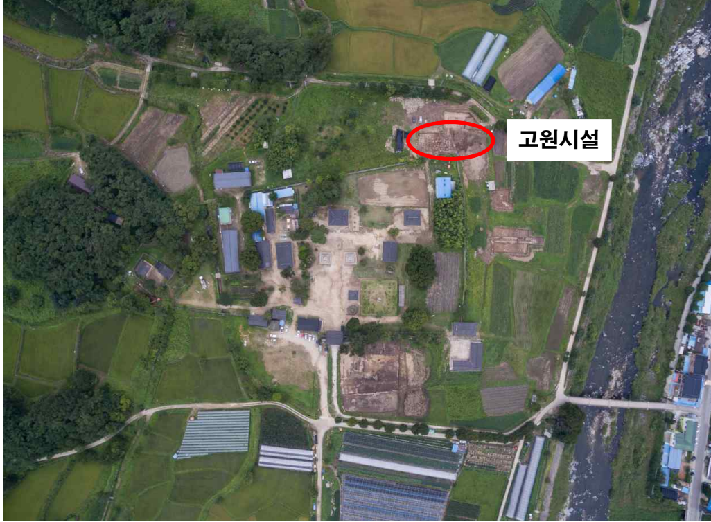
<남원 실상사 전경>