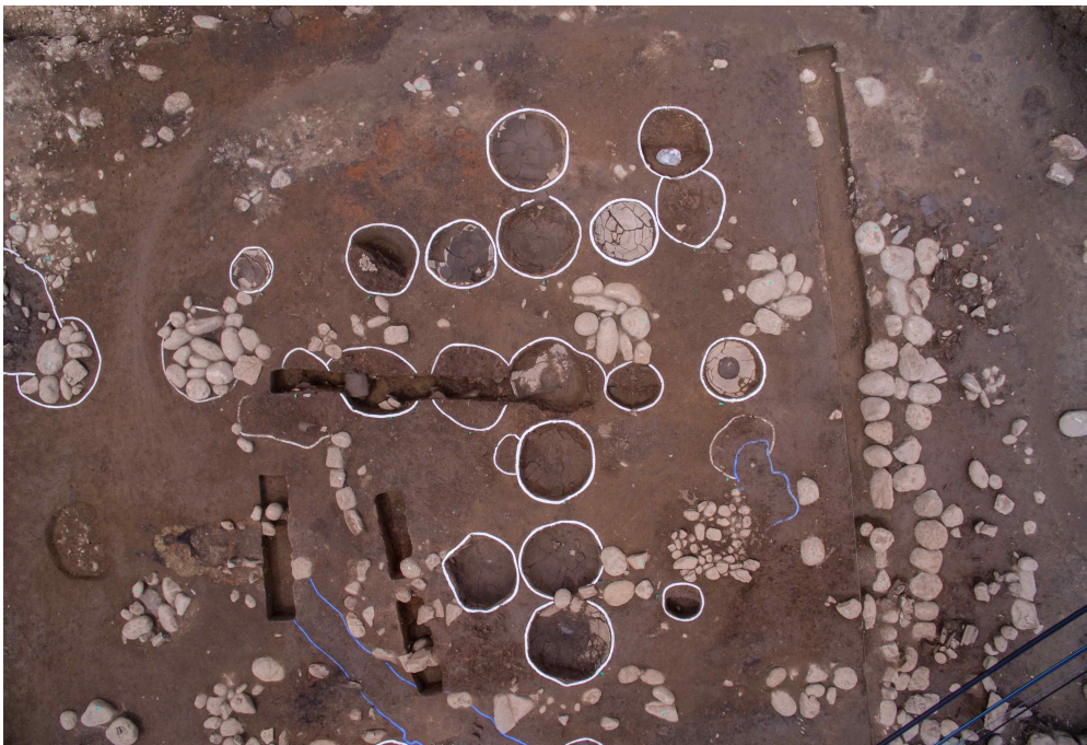
<통일신라 시대 고원(庫院) 조사 현황>