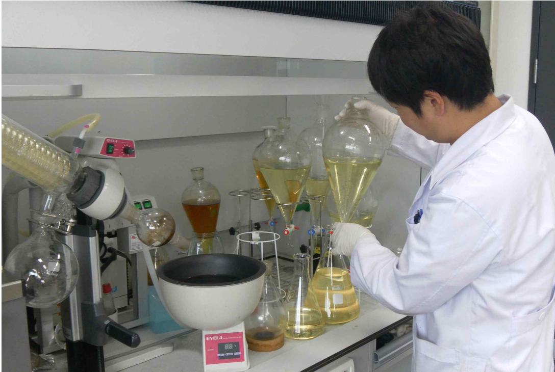
<죽두리풀에서 생리활성물질을 추출하는 모습>