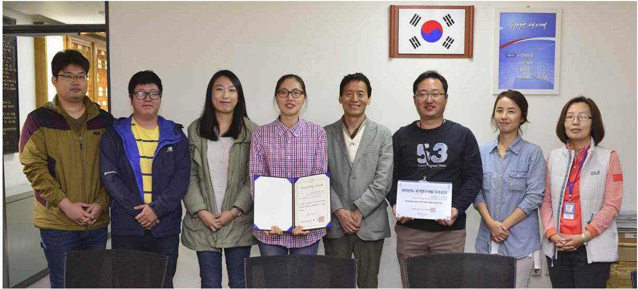
<국립문화재연구소 보존과학연구실 연구팀>