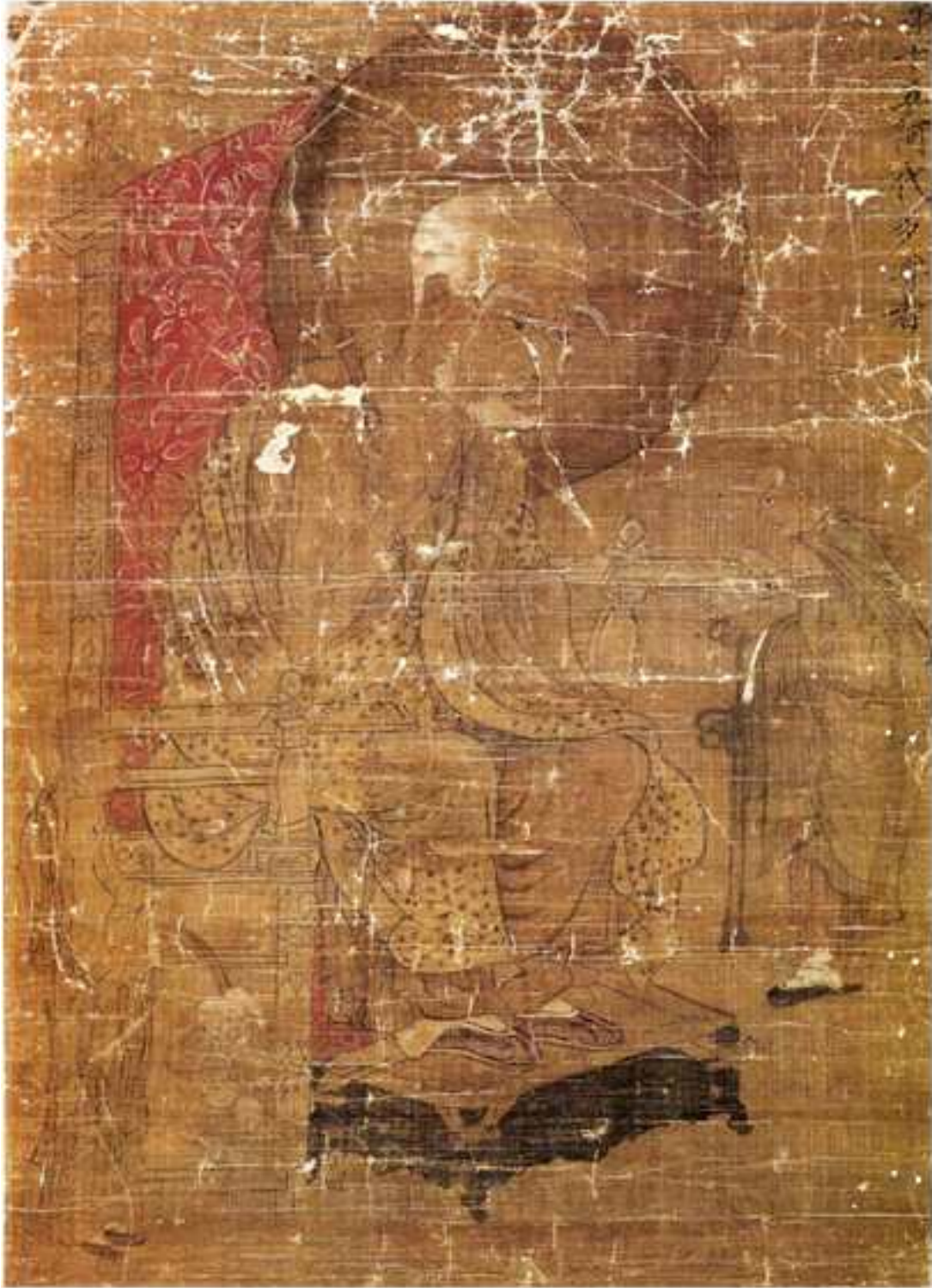
<고려 십육나한도(제15 아별다존자)>