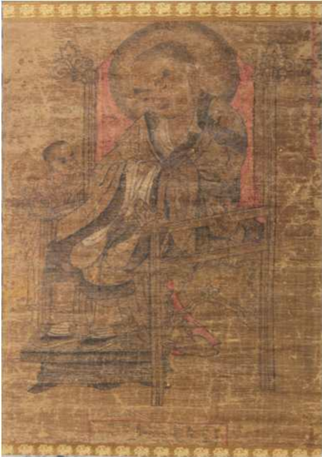
<고려 십육나한도(제7 가리가존자)>