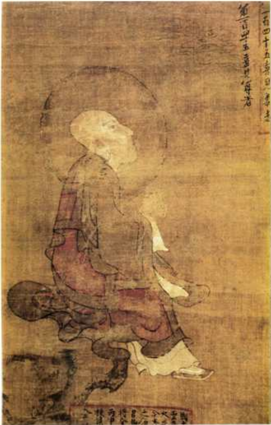
<고려 오백나한도 중 제145 희견존자도>