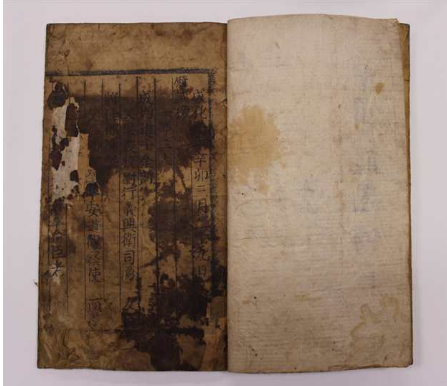
<신묘삼월 문무과전시방목 - 권수제>