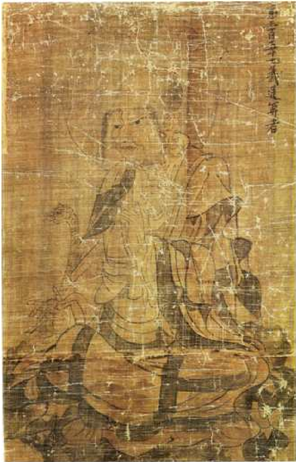
<고려 오백나한도 중 제357 의통존자도>