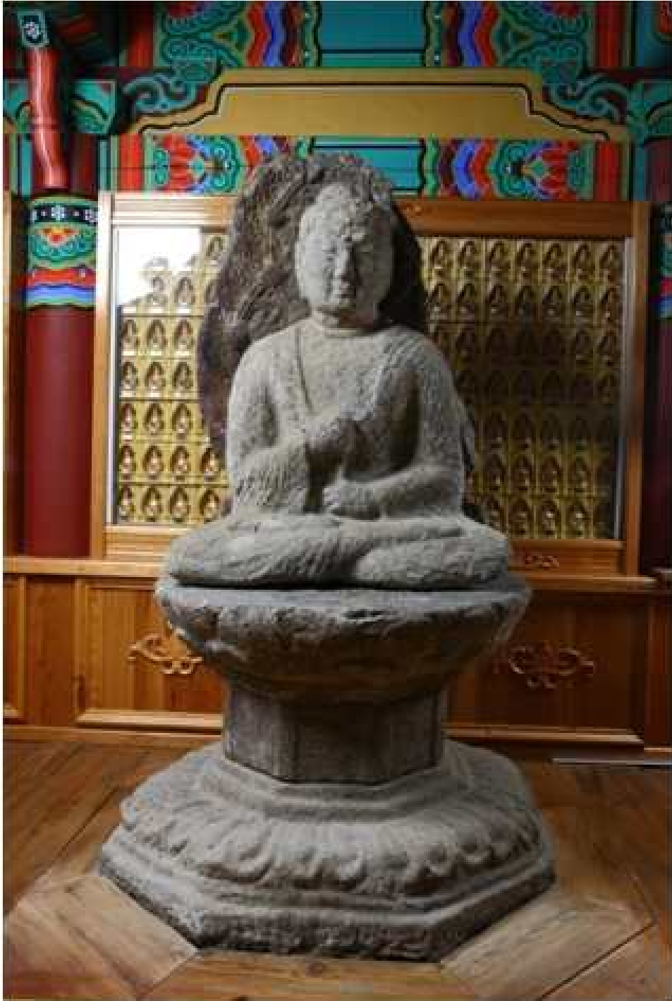
<산청 석남암사지 석조비로자나불좌상>