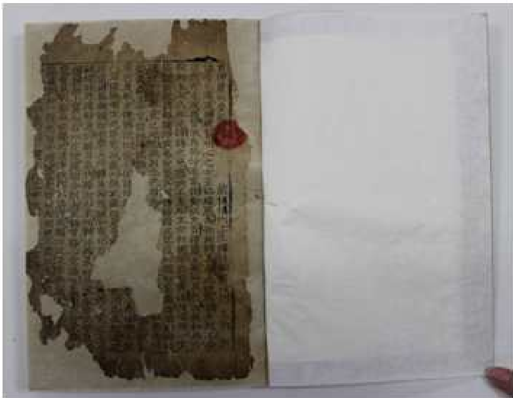
<대불정여래밀인수증요의제보살만행수능엄경 - 서>