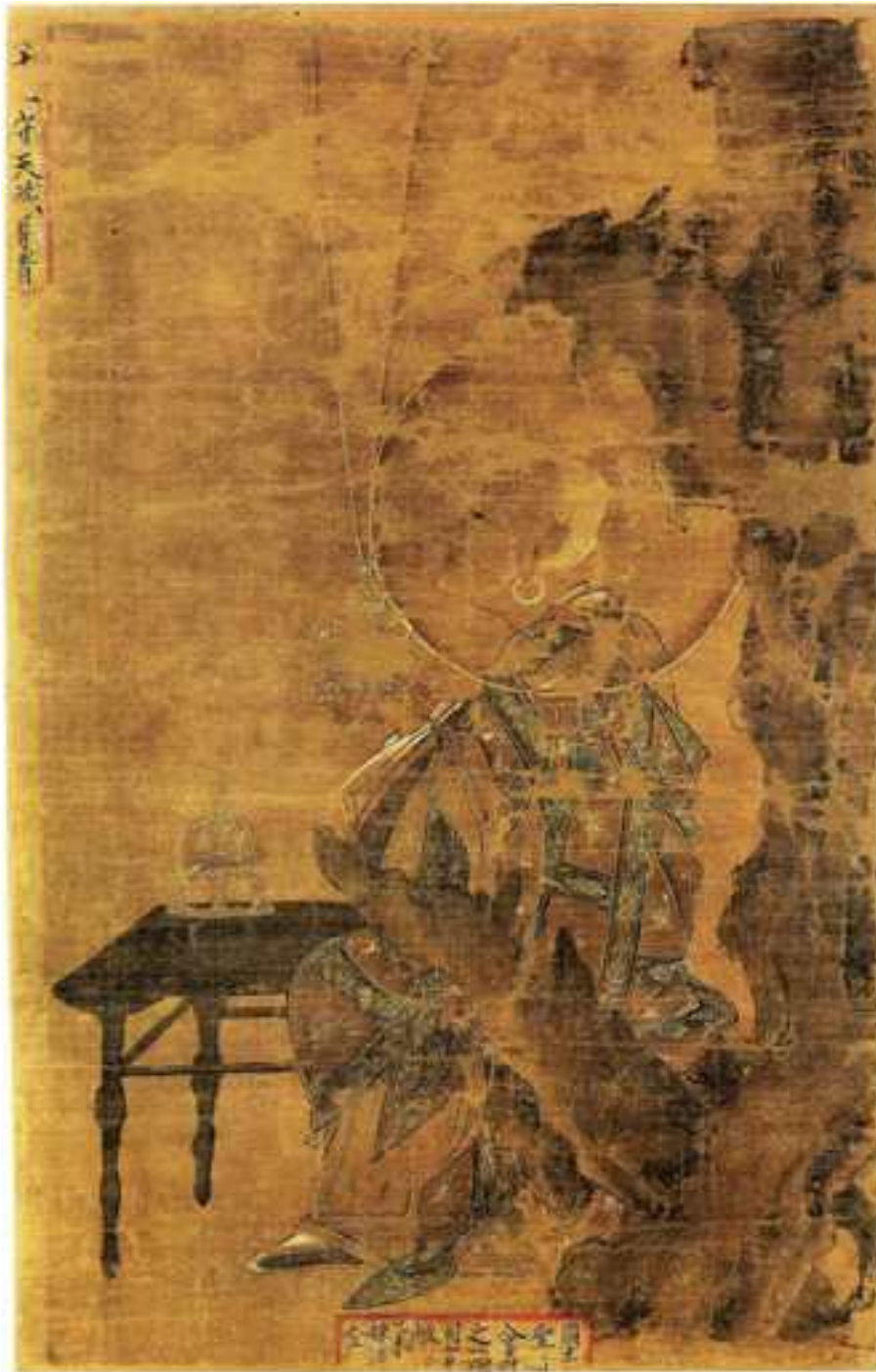
<고려 오백나한도 중 제92 수대장존자도>