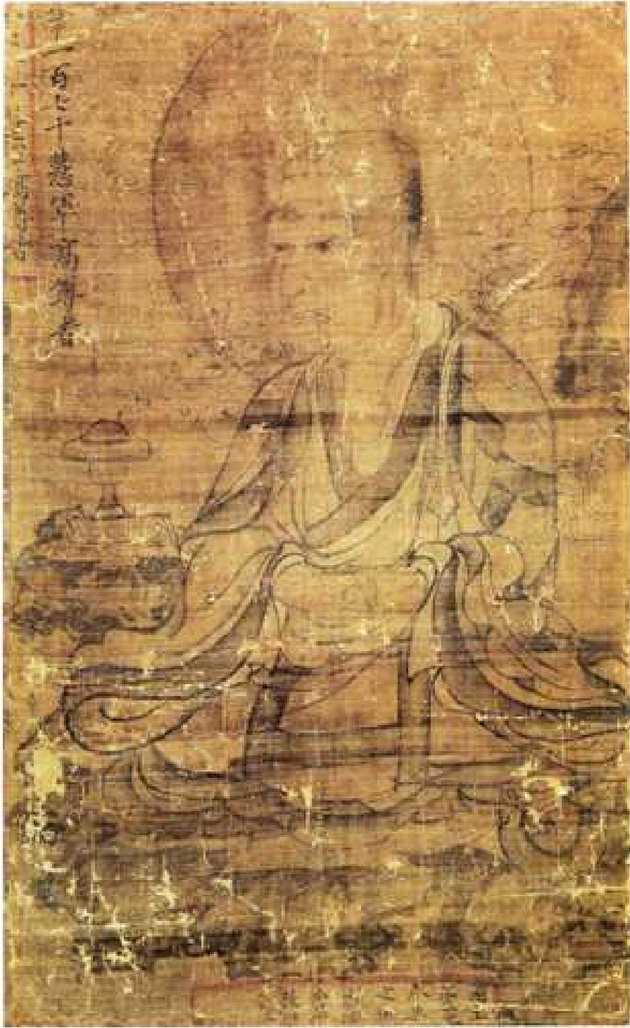
<고려 오백나한도 중 제170 혜군고존자도>