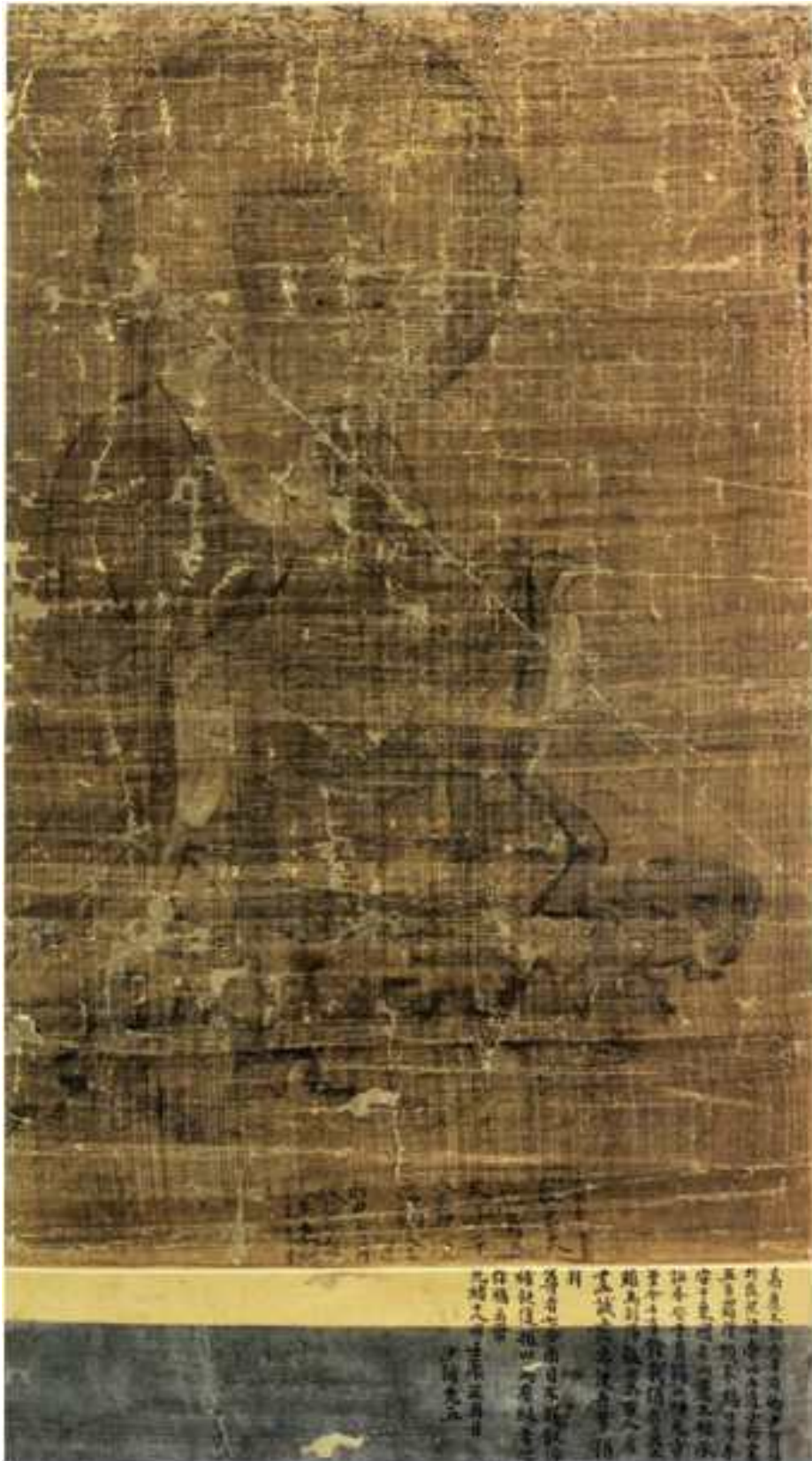
<고려 오백나한도 중 제427 원원만존자도>