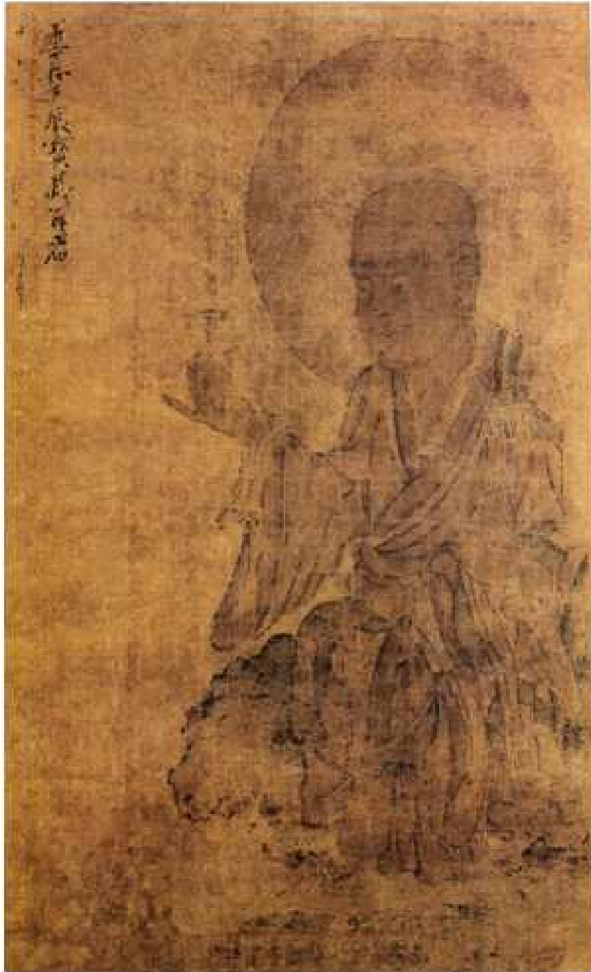
<고려 오백나한도 중 제125 진보장존자도>