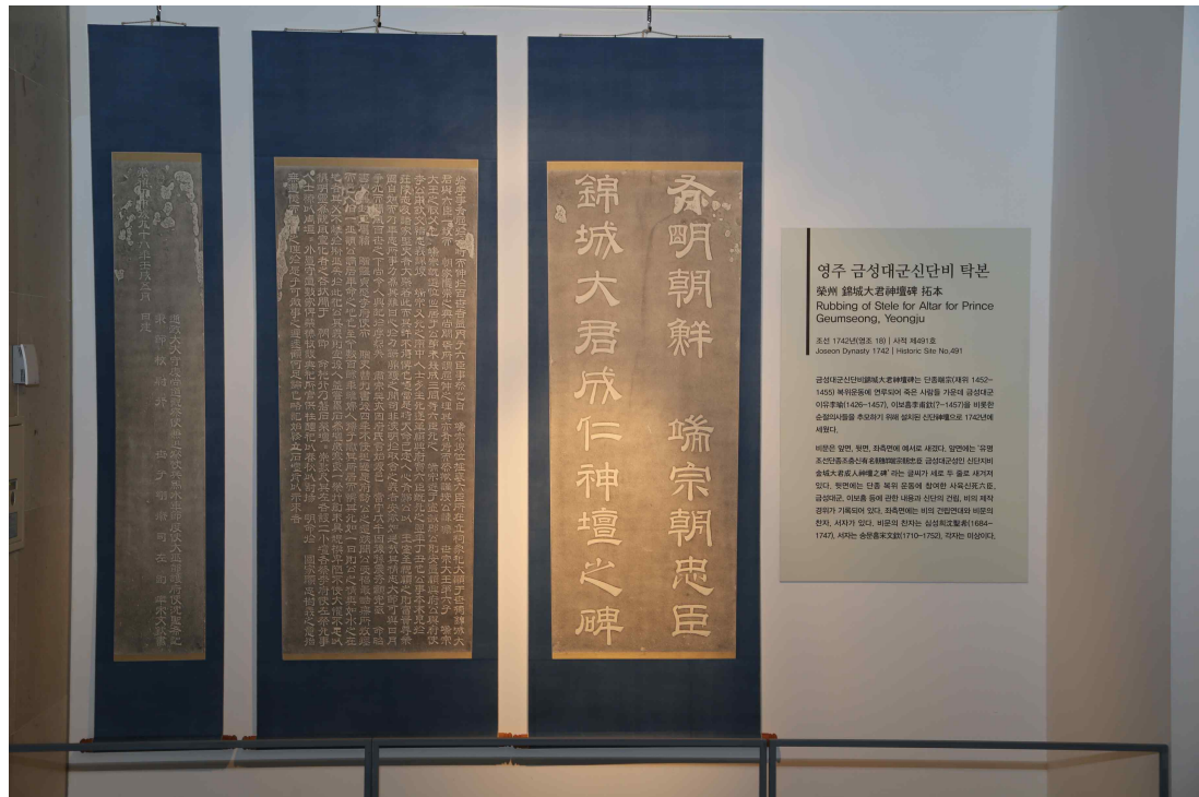
<‘2016 금석문 탁본전’ 전시 - ‘영주 금성대군 신단비’ 탁본>