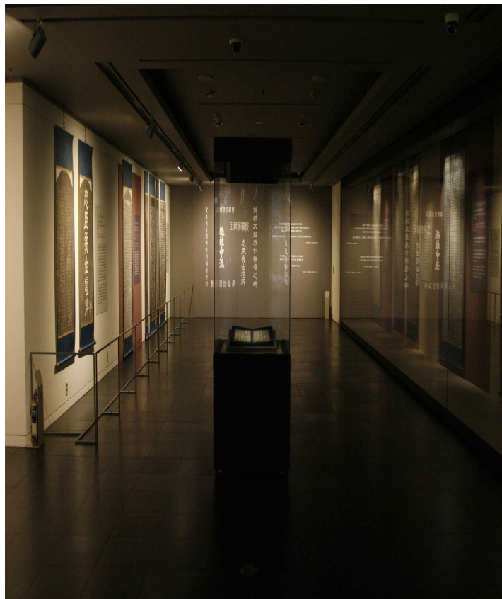
< '2016 금석문 탁본전' 전시실 전경 >