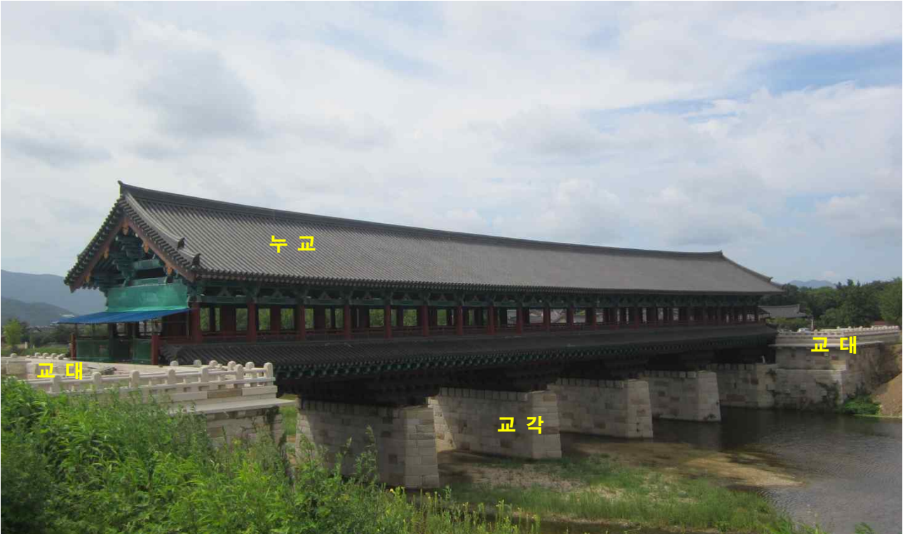
<경주 월정교 전경>