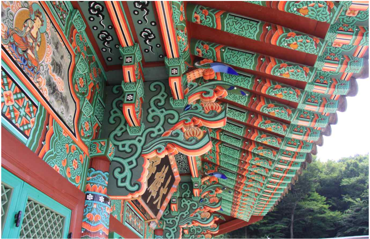
<공포 - 정면>