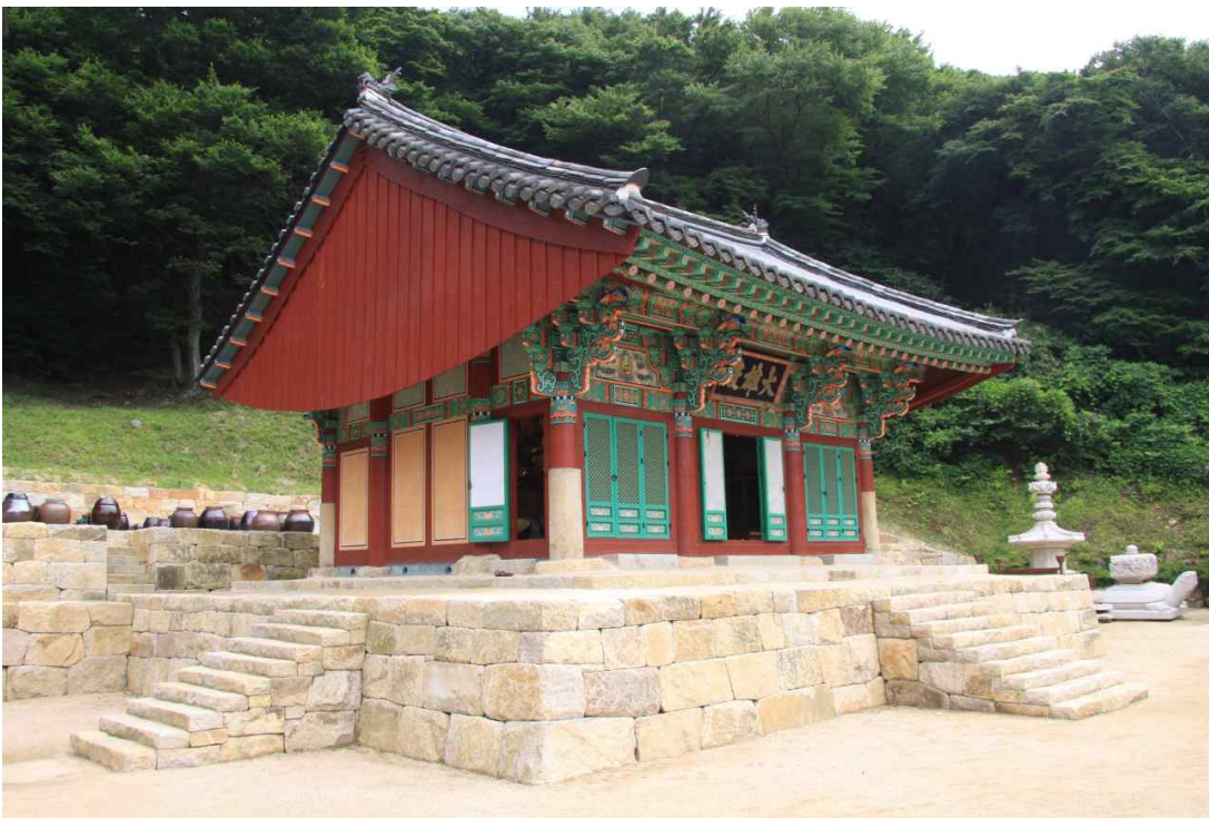
<부산 운수사 대웅전>