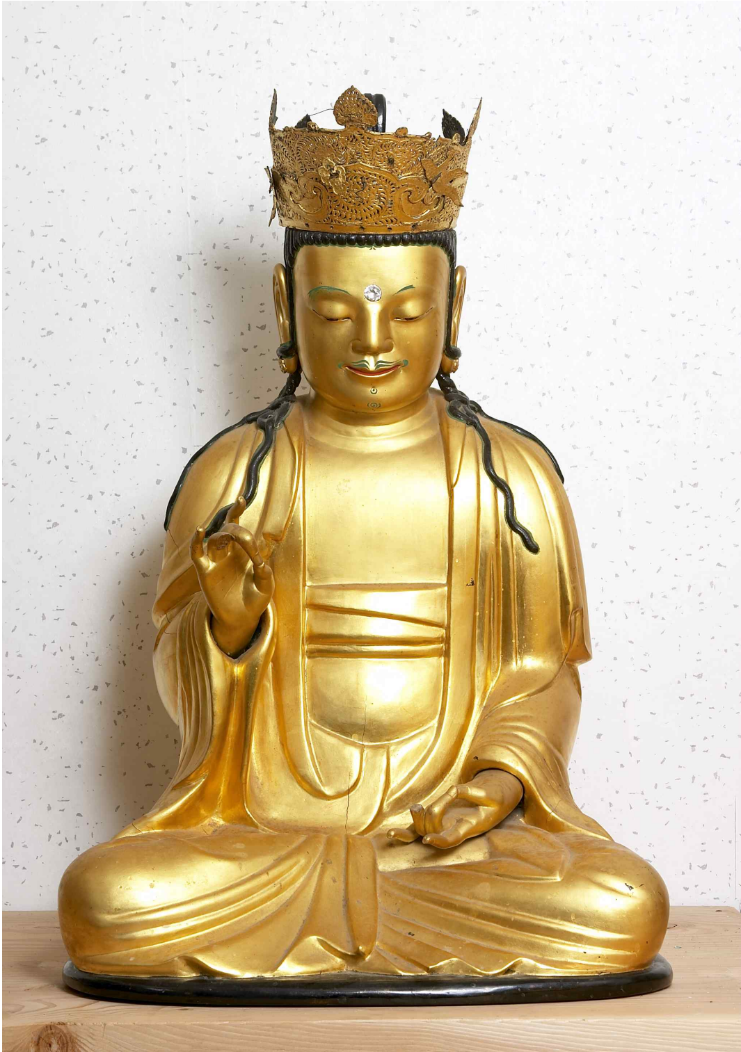
<구례 천은사 대세지보살좌상>