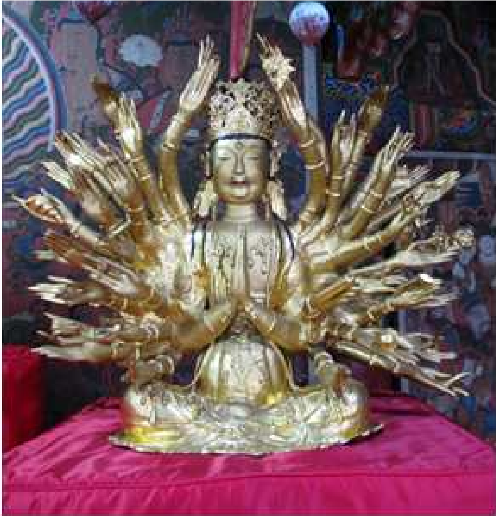
<서울 홍천사 금동천수관음보살좌상>