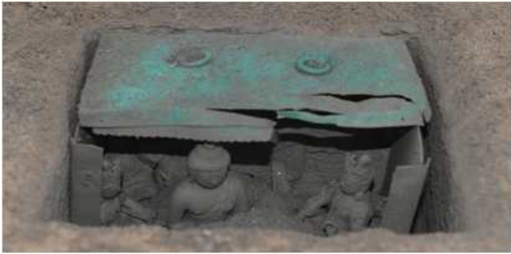
<익산 심곡사 칠층석탑 출토 금동불감>