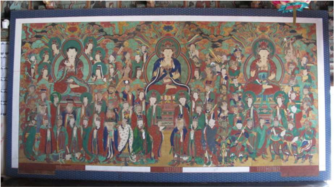
<구례 천은사 삼장보살도>