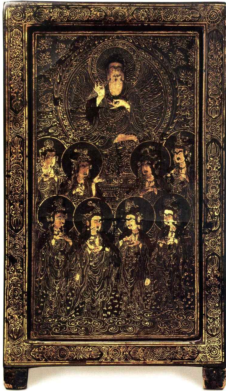
<노영 필 아미타여래구존도>