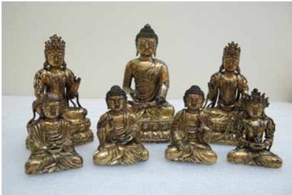
<익산 심곡사 칠층석탑 출토 금동아미타여래칠존좌상>