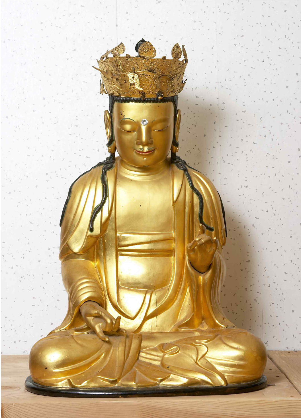
<구례 천은사 관세음보살좌상>