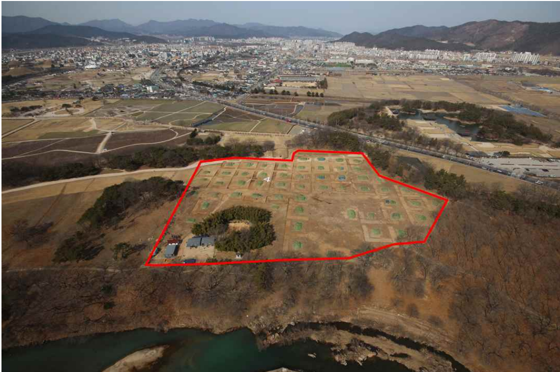
<월성 중앙지역(C지구) 전경>