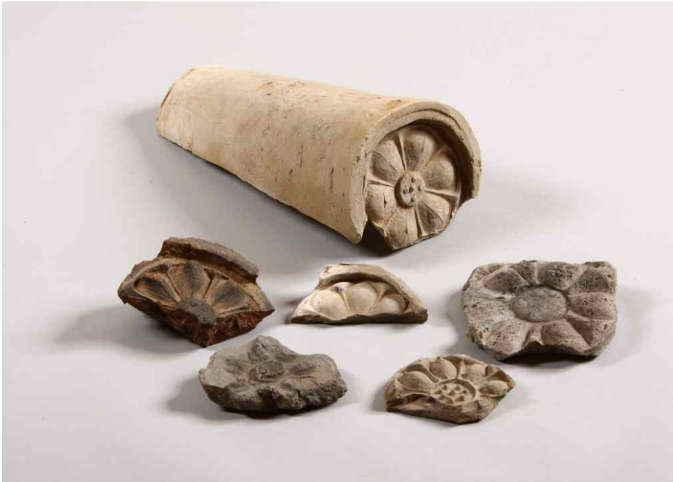
<7세기 제작 수막새>