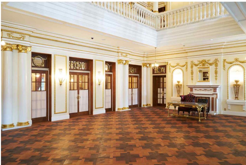
< 공연장소 - 1층 중앙홀 >