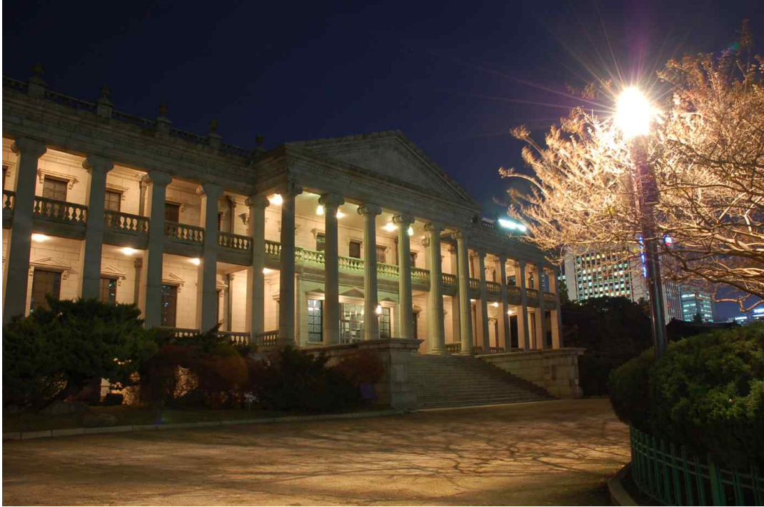
< 덕수궁 석조전 야간 전경 >