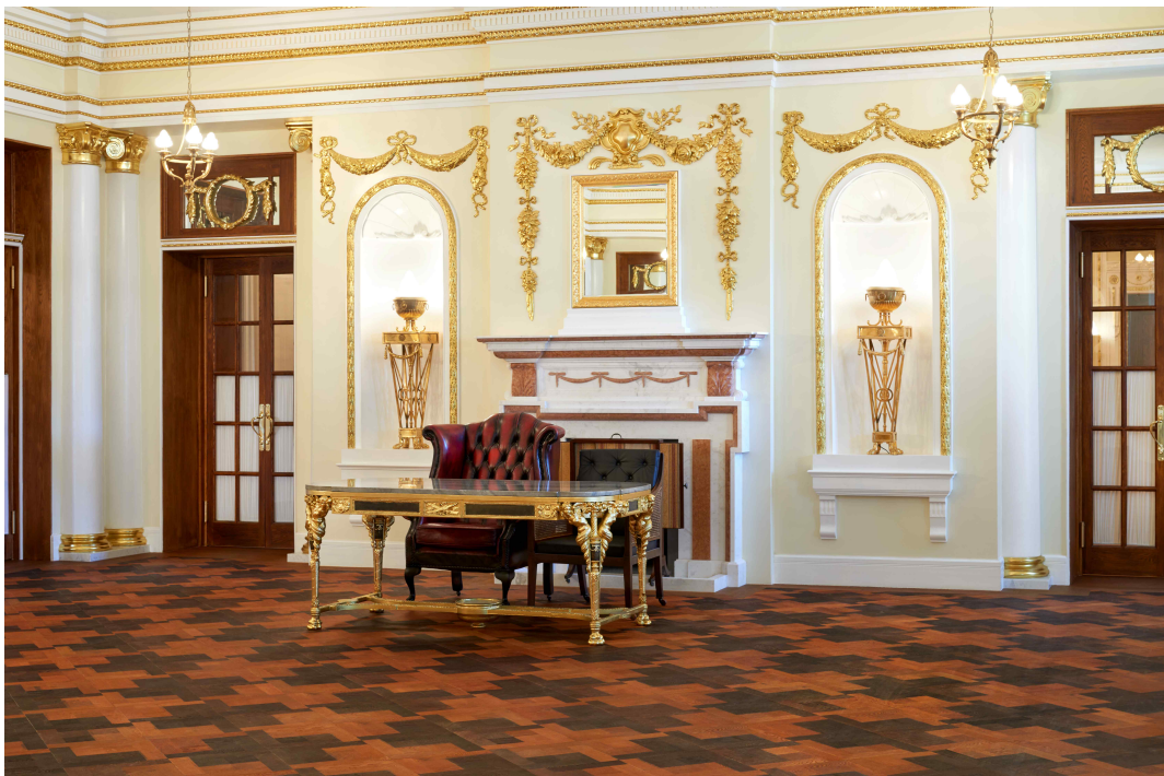
< 1층 중앙홀 복원 후(2014년) >