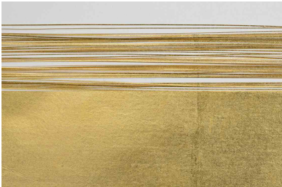
< 복원한 금사 세부 >