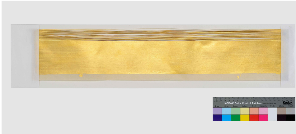
< 복원한 금사 >