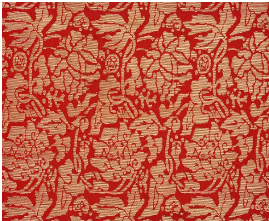
< (복원 후) 17세기 초 연화문 직금단 >