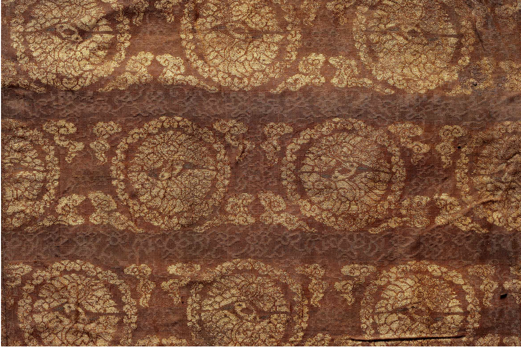
< (복원 전) 16세기 초 금원문직금능 >