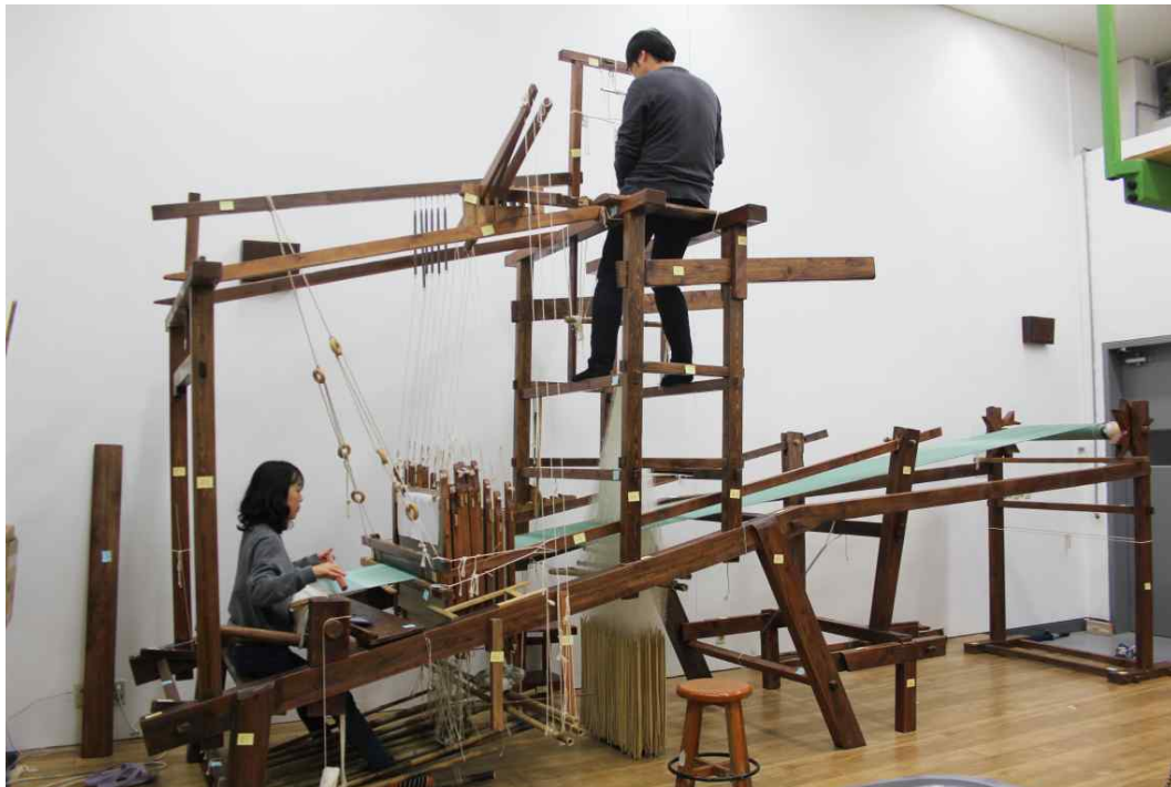
< 복원한 수공 문직기 >