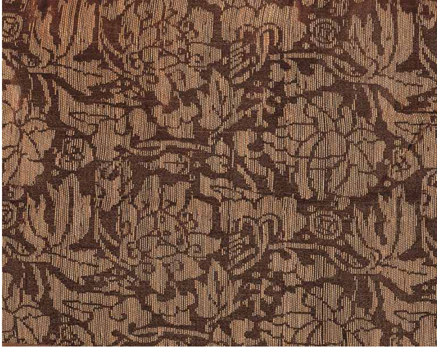
< (복원 전) 17세기 초 연화문 직금단 >