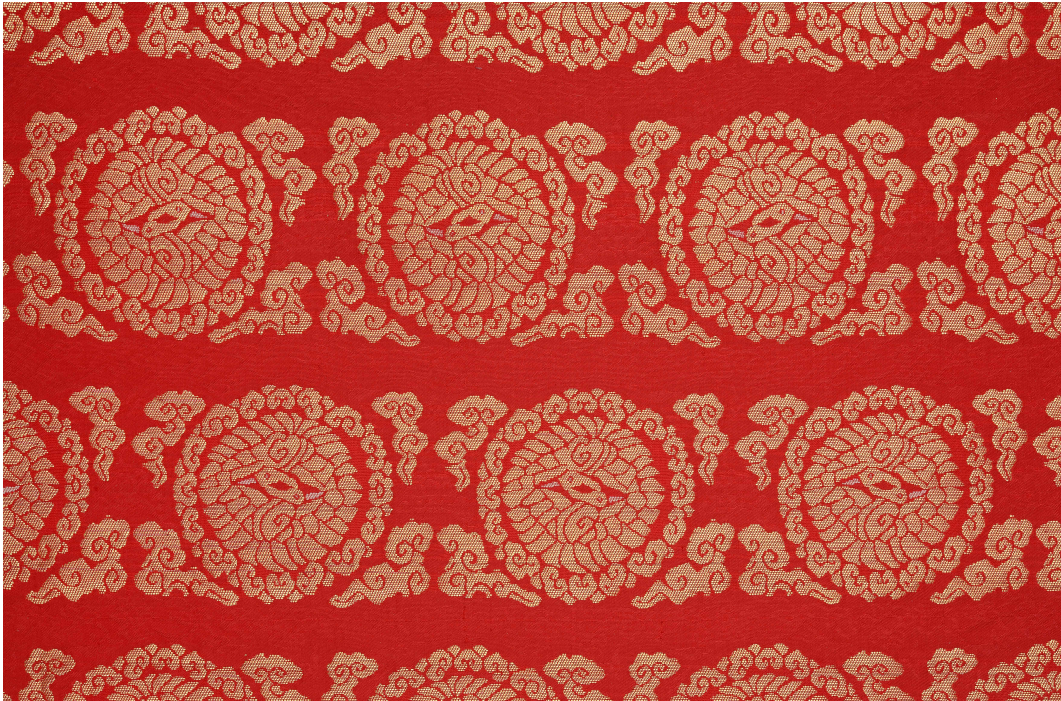
< (복원 후) 16세기 초 금원문직금능 >