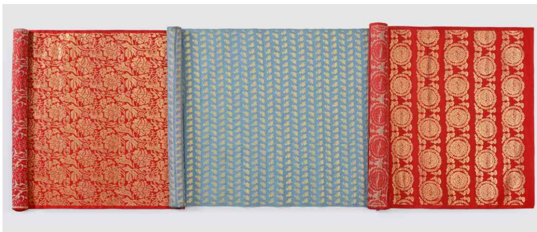
< 복원한 직금 직물 3종 >