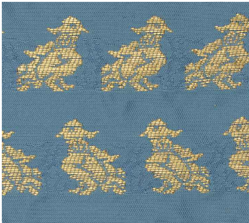
< (복원 후) 고려 시대 남색원앙문직금능 >