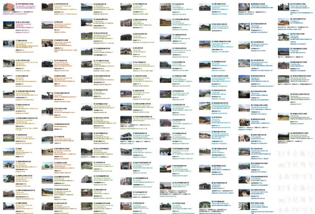
< 무형문화재 전수교육관 전국지도 >