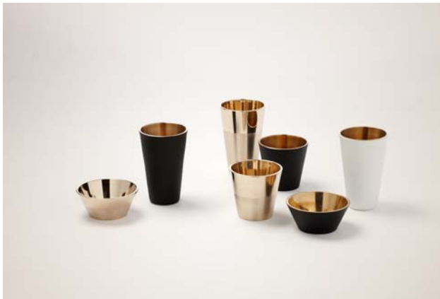
△ 중요무형문화재 제77호 유기장 이수자 배병식 / 디자이너 송봉규 / 유기컵