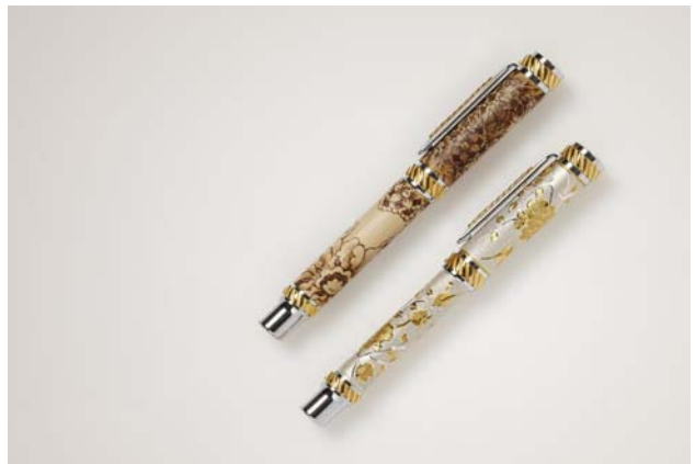
△ 중요무형문화재 제60호 장도장 이수자 정윤숙 / 디자이너 정석연 / 만년필