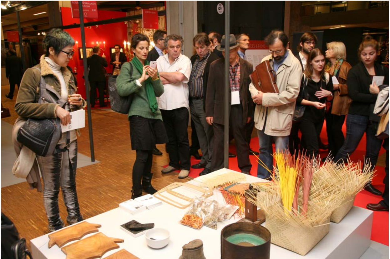
< 문화유산박람회(프랑스 파리) 전시 모습 >