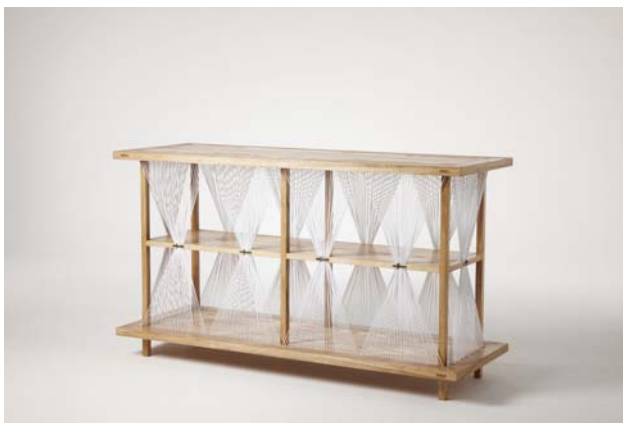
△ 중요무형문화재 제55호 소목장 이수자 유진경 / 디자이너 김상윤 / 수납장