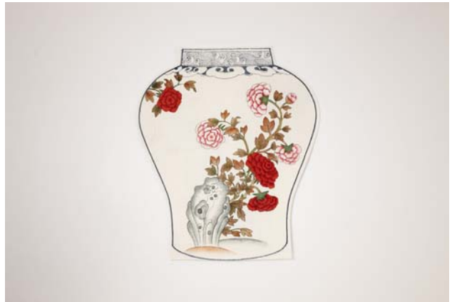
△ 중요무형문화재 제118호 불화장 이수자 이일진 / 디자이너 이유주 / 조명갓