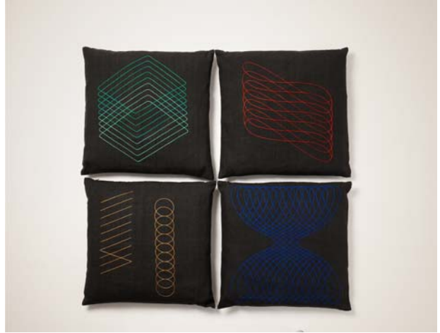
△ 중요무형문화재 제80호 자수장 이수자 이명애 / 디자이너 이에스더 / 방석