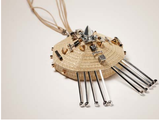
△ 중요무형문화재 제103호 완초장 이수자 박순덕 / 디자이너 장혜림 / 목걸이