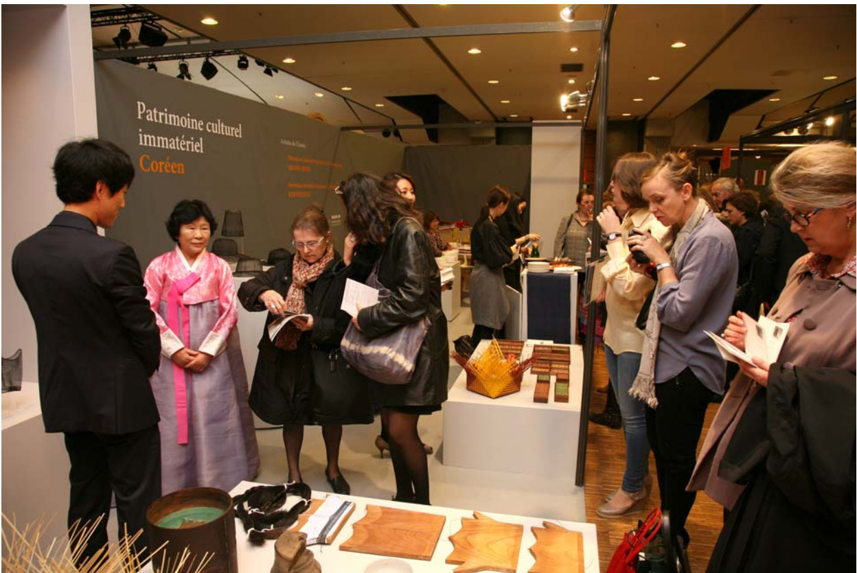
< 문화유산박람회(프랑스 파리) 전시 모습 >