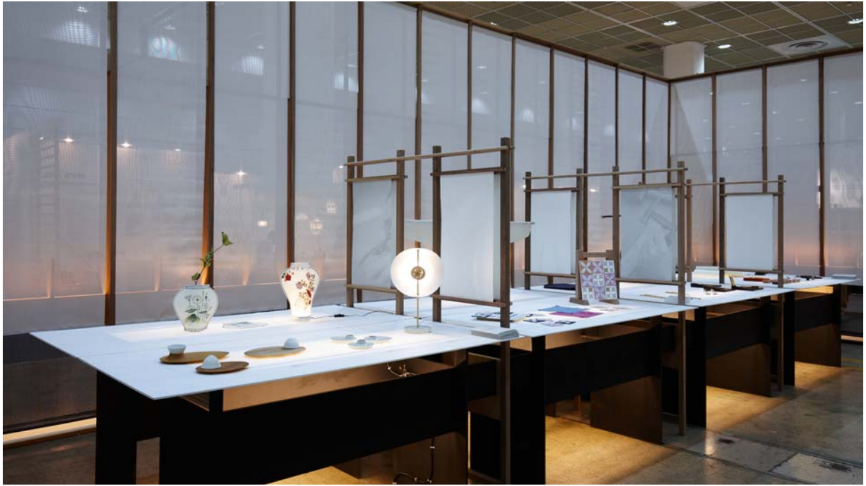
< '2014 결' 전시장 모습 >