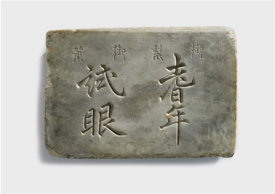
영조 시력측정 글 / 조선 1758년(영조 34) / 국립고궁박물관 소장