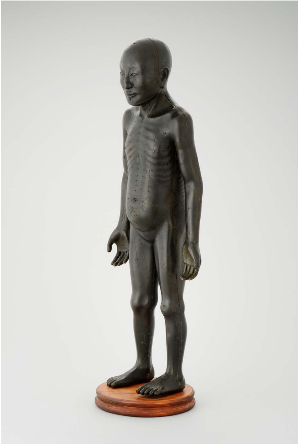
경혈을 표시한 동인銅人 靑銅經穴人體像 / 조선 / 국립고궁박물관 소장 침구를 공부하기 위해 구리로 만든 사람 모형이다