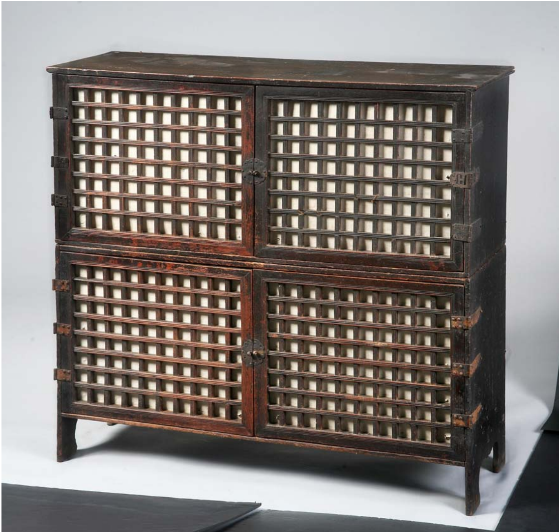
각계수리약장 藥櫥 /조선 / 동아대학교석당박물관 소장 약재를 분류하여 넣을 수 있는 서랍이 달린 가정용 약장으로 간단한 질병에 대비한 우리 선조의 모습을 볼 수 있다.