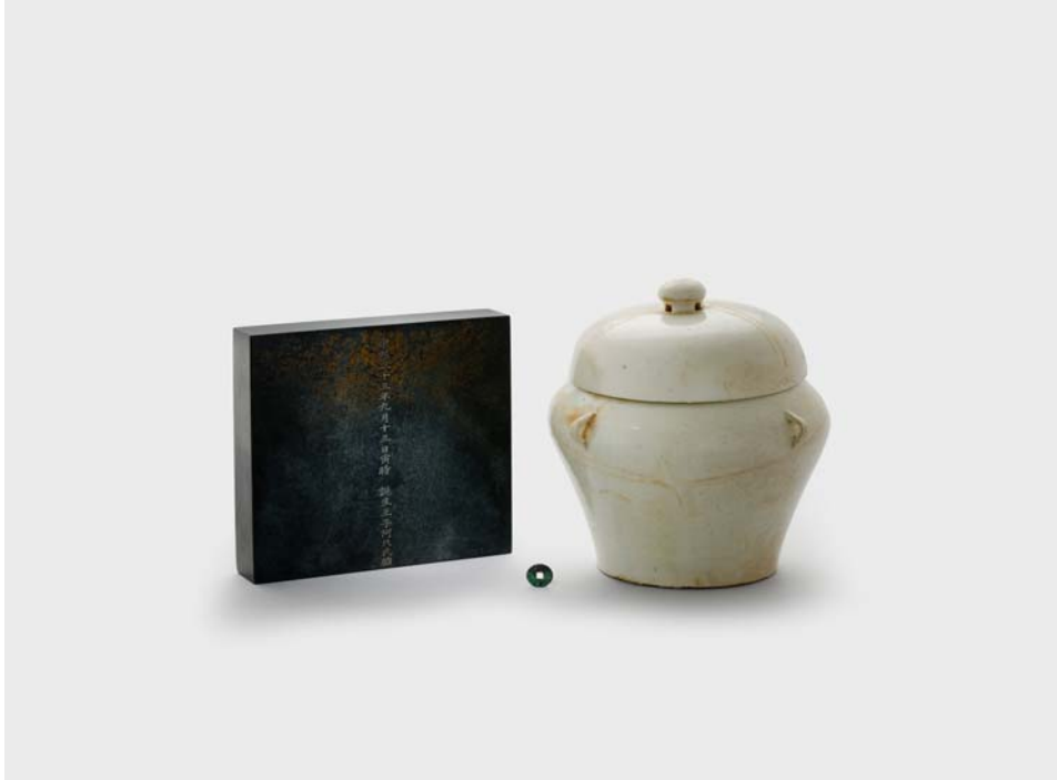
영조 태항아리, 태지석, 개원통보 英祖 胎壺, 胎誌石, 開元通寶 / 조선 1695년 / 국립고궁박물관 소장