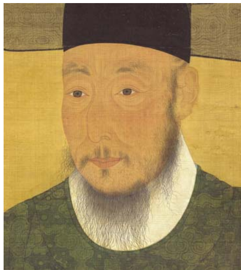
반곡 이덕성 초상 盤谷李德成肖像 / 조선 1696년 / 보물 제1501호 / 부산박물관 소장 조선시대 전체 초상화 중 14%에서 얼굴에 천연두 반흔을 볼 수 있다. 이를 통해 천연두가 조선시대 전반에 걸쳐 창궐했다는 사실을 짐작할 수 있다.