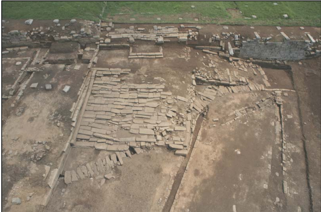
< 문지와 계단 전경(서에서) >