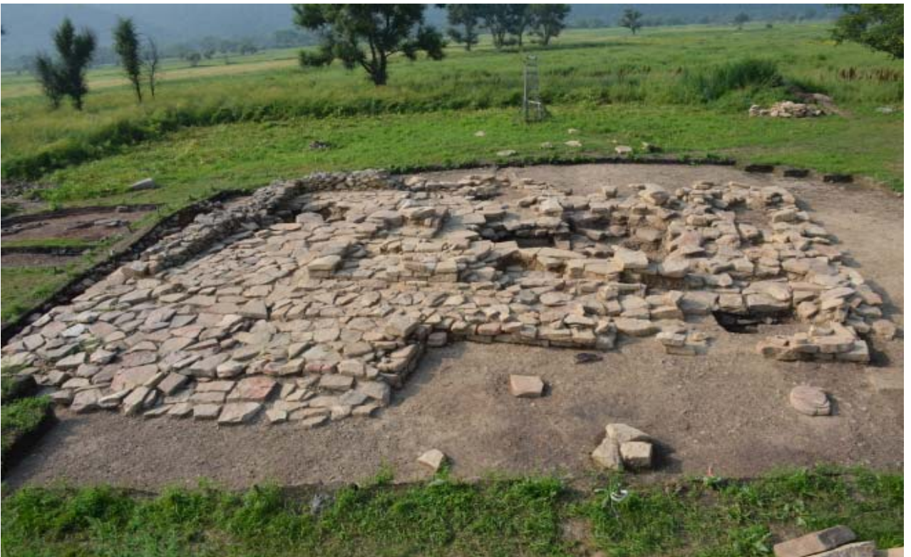
< 곡샤롭카 고분 전경 >