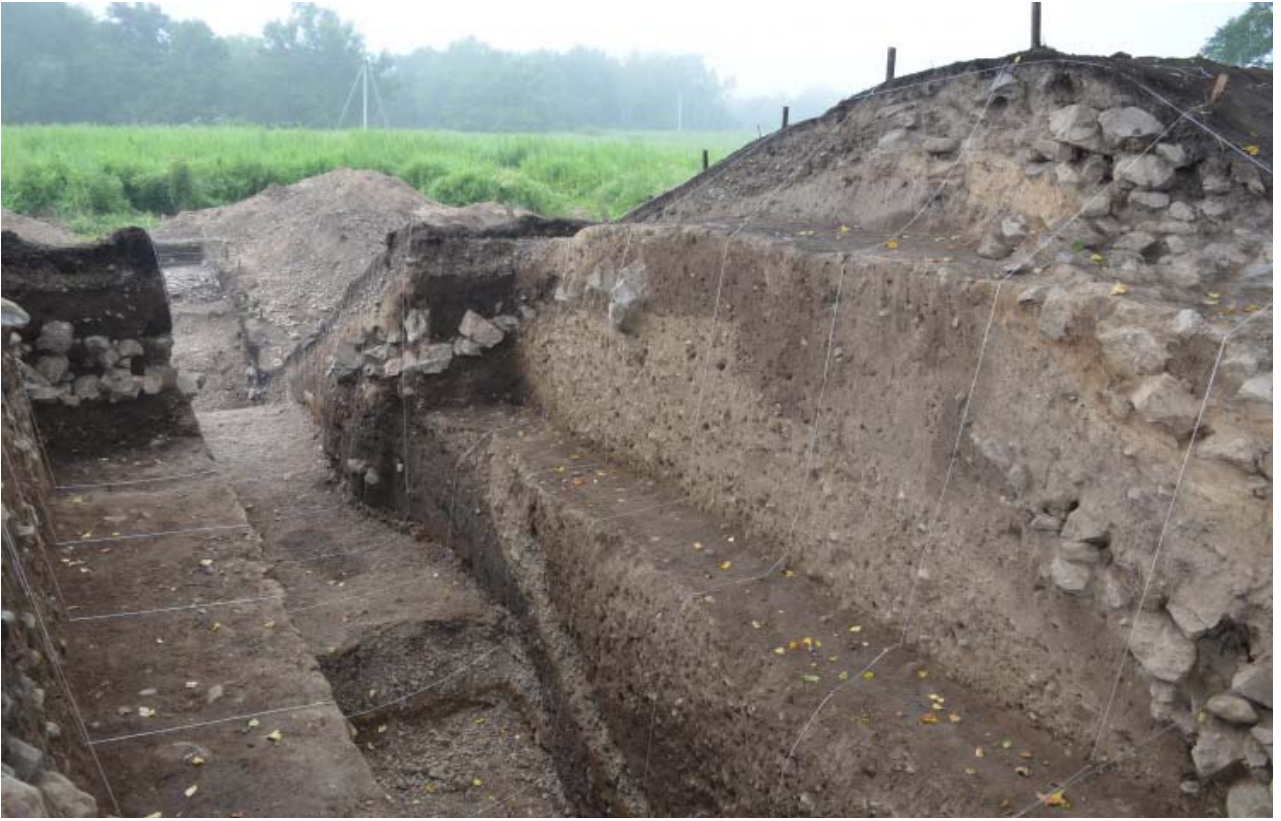
< 곡샤롭카 평지성 성벽 전경(안→밖) >