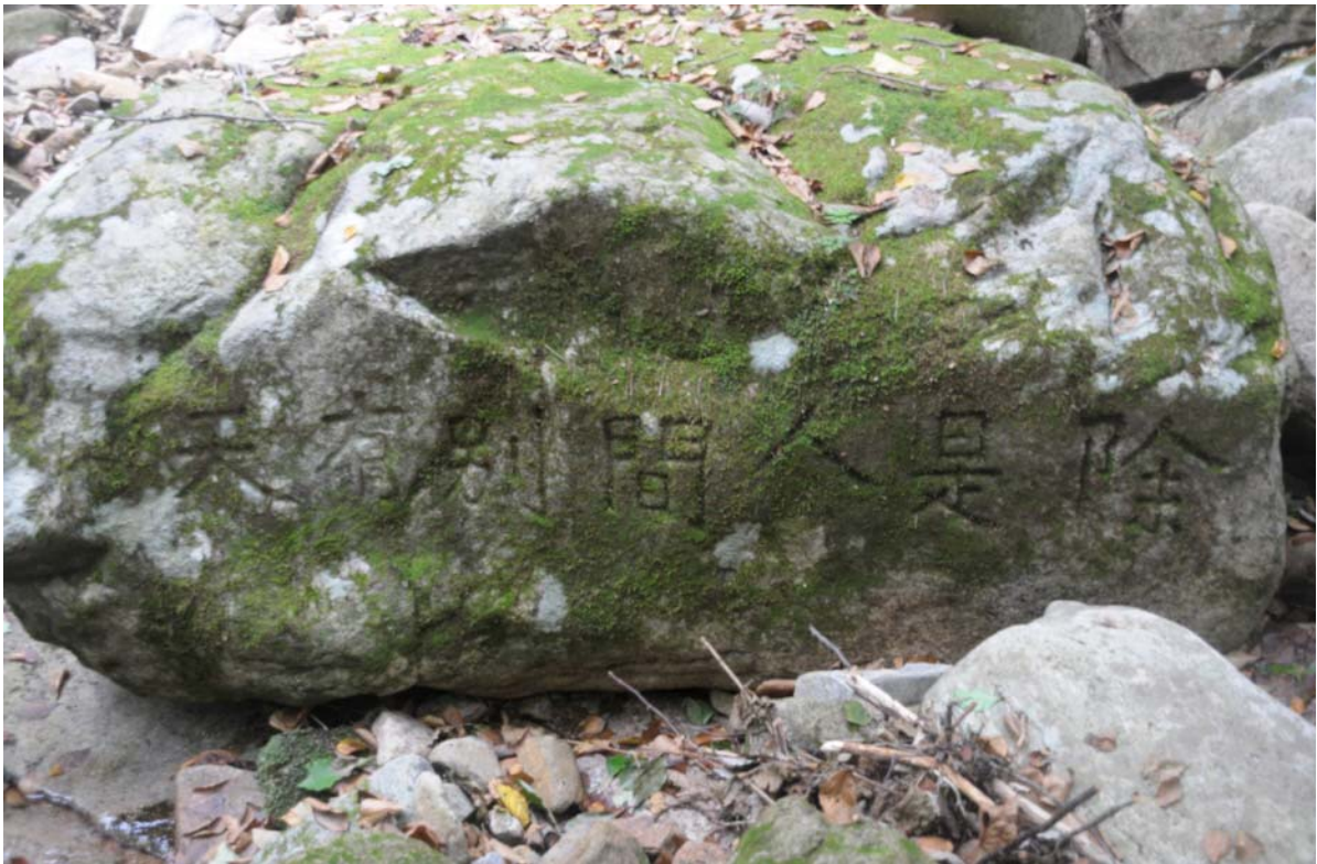
< 제9곡 활연대(豁然臺) 제시인간별유천(除是人間別有天) 소립탁이(所立卓爾) >