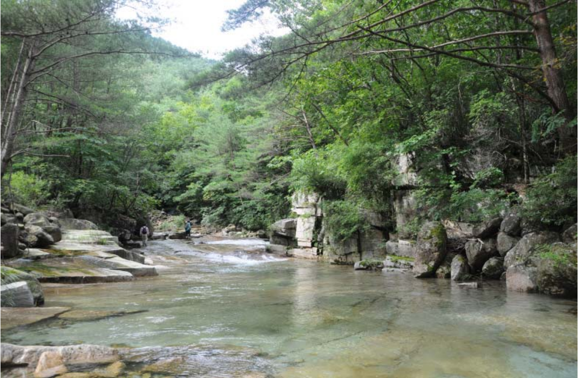
< 제2곡 선미대(仙味臺) 전산기중(前山幾重) >