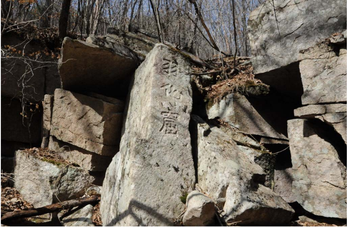
< 제6곡 우화굴(羽化窟) 원조춘한(猿鳥春閒) >