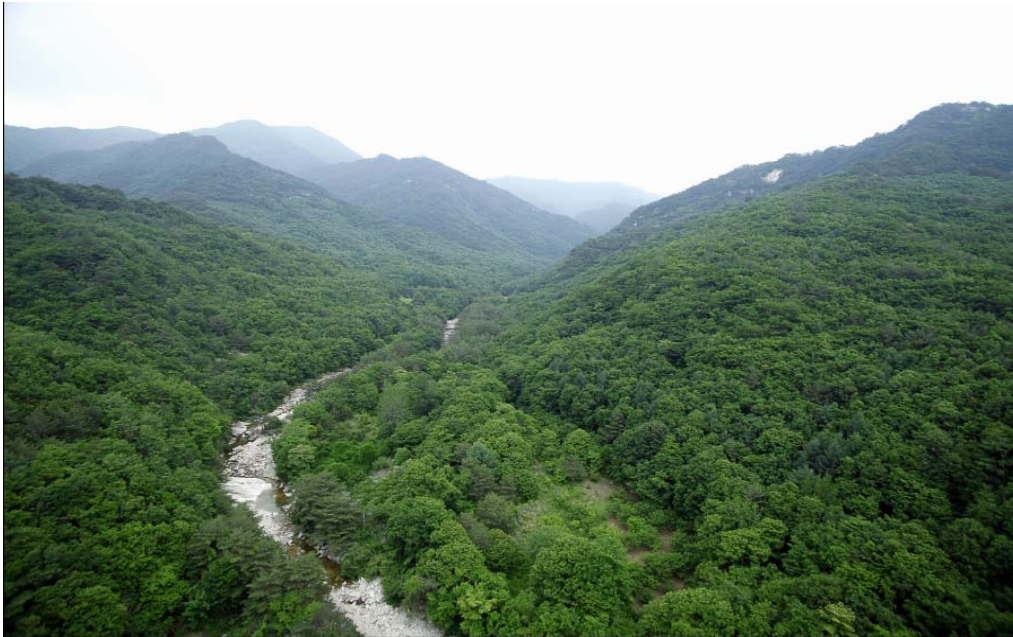
< 용하구곡 전경 항공사진 >