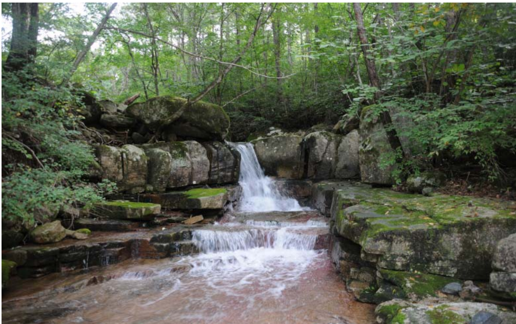
< 제1곡 청벽대(聽碧臺) 홍단연쇄(虹斷烟鎖) >