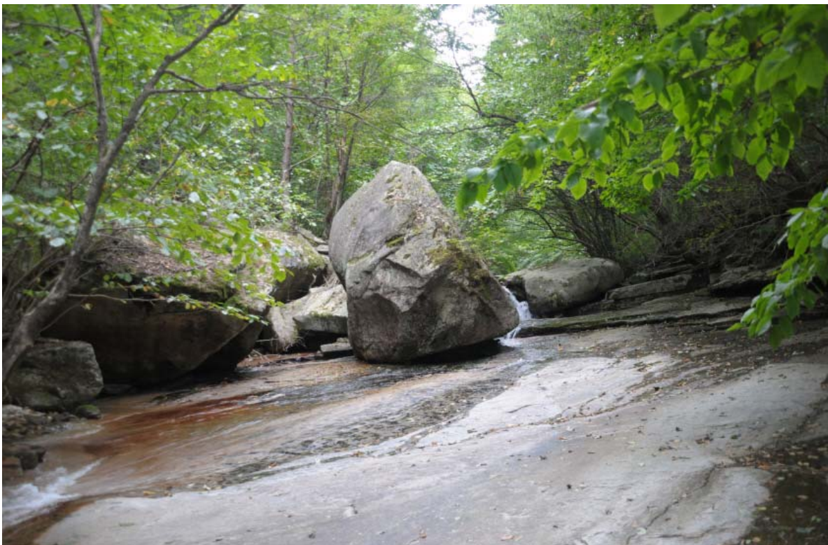
< 제3곡 호호대(好好臺) 가학정도(架壑停棹) >