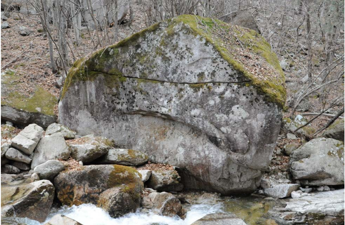
< 제4곡 섭운대(躡雲臺) 암화수로(巖花垂露) >