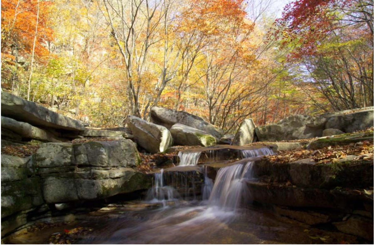
< 제8곡 활래담(活來潭) 풍연욕개(風烟欲開) >