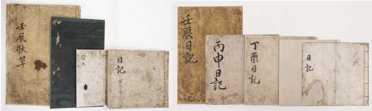
< 난중일기(계사·갑오·임진·병신·정유·속정유·무술일기) 및 임진장초 서간첩 >