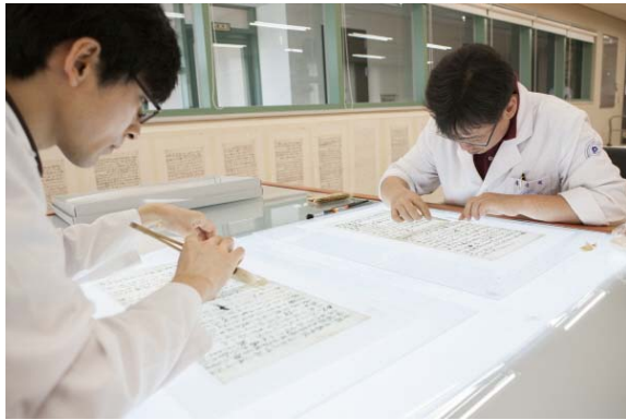
< 난중일기 보존처리(내지 결실부 보강) >