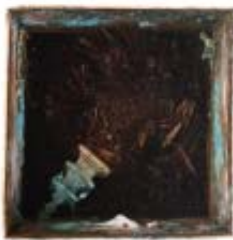
경주 나원리 출토 사리장엄 X선 조사 결과