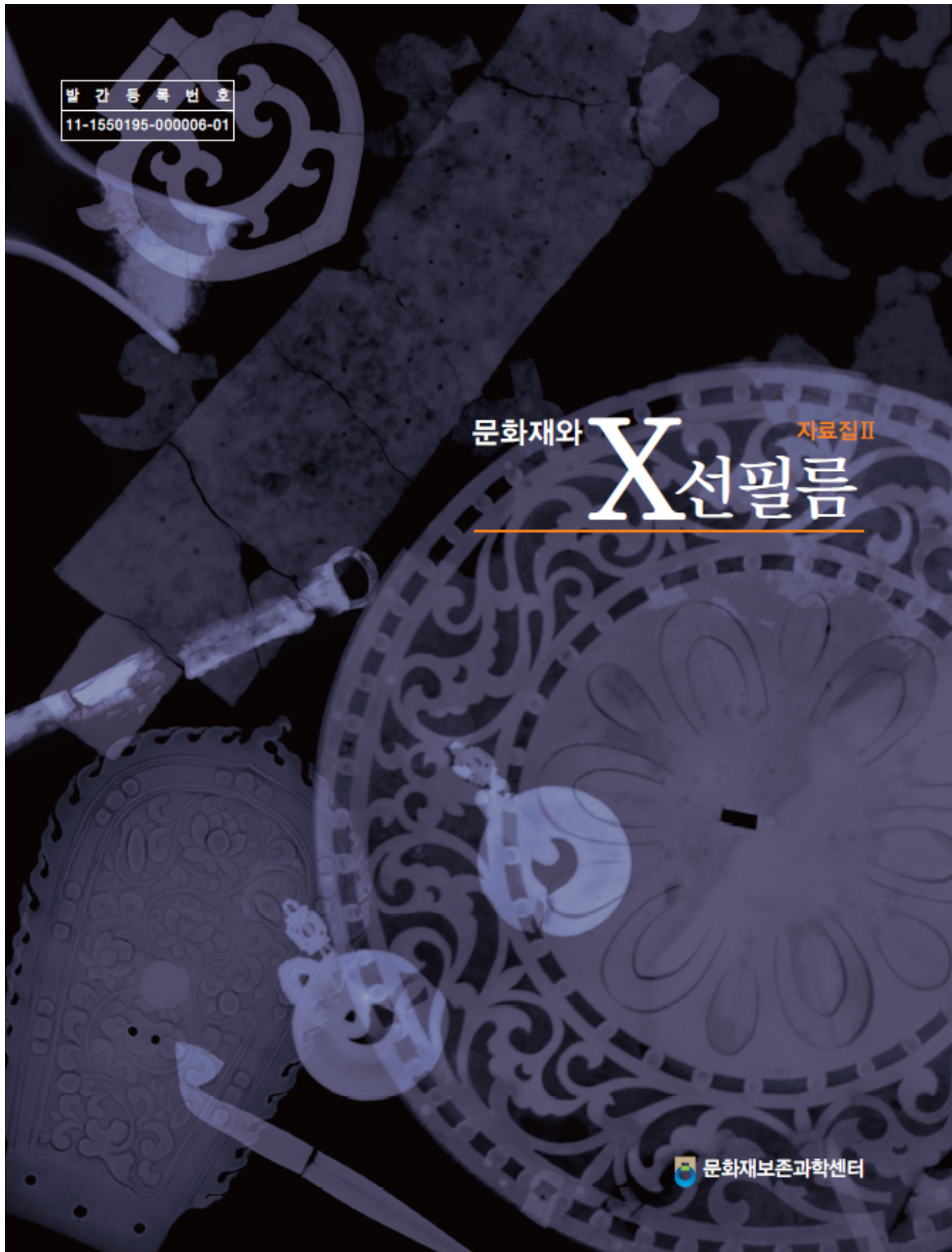
「문화재와 X선 필름」 (자료집 II) 표지