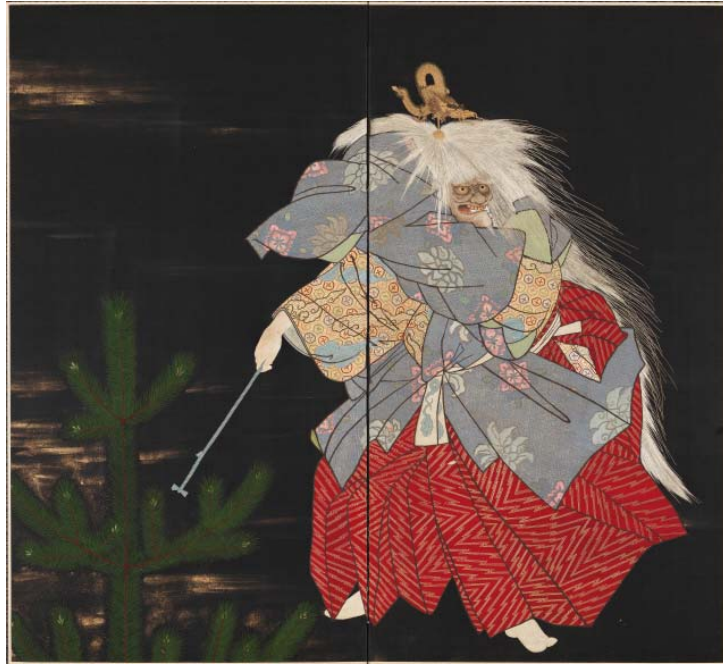
작가 미상, 일본 가면극을 수놓은 가리개(岩船圖刺繡二幅屏), 20세기 초, 각 폭 165.0×90.4cm