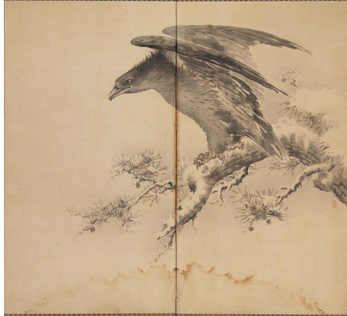
시미즈 도운, <매 그림(鷹圖)>, 1910년경, 각 폭 171.0×92.9cm