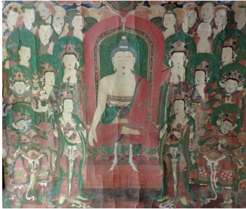
<기장 고불사 영산회상도>