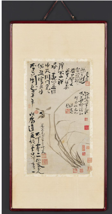
<김정희 필 불이선란도>