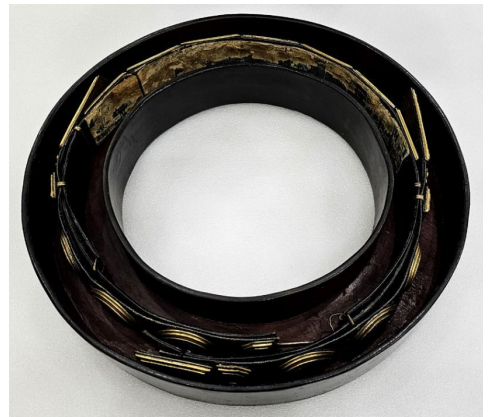
<이순신 유물 일괄-요대함>