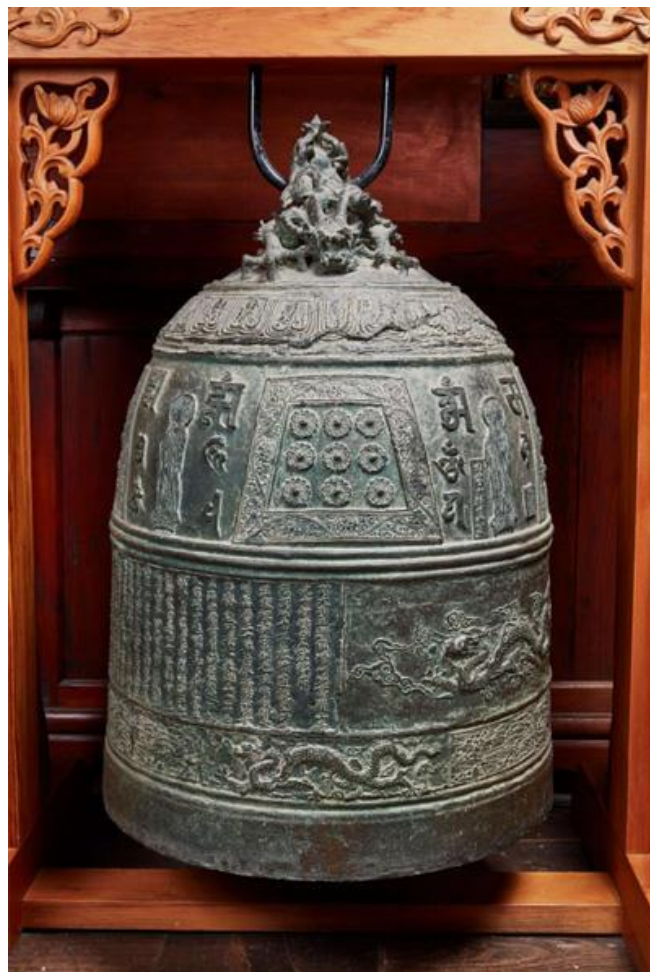
<파주 보광사 동종>