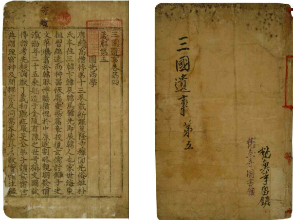
보물 제419-3호 삼국유사 권4~5