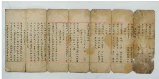
공주 갑사 소조석가여래삼불좌상·사보살입상 복장전적 (백지묵서금강반야바라밀경)