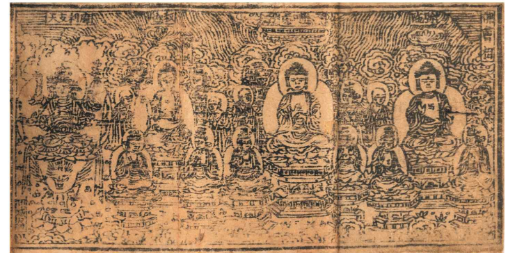
합천 해인사 원당암 목조아미타여래삼존상 복장전적 (제다라니경 변상도)