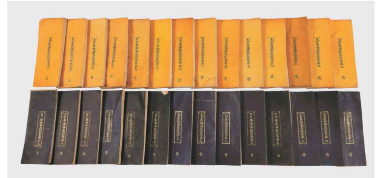
합천 해인사 원당암 목조아미타여래삼존상 복장전적(화엄경 진본 및 정원본)