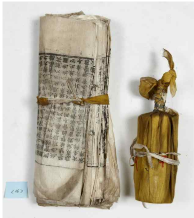
공주 갑사 소조석가여래삼불좌상· 사보살입상 복장유물