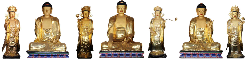
공주 갑사 소조석가여래삼불좌상·사보살입상