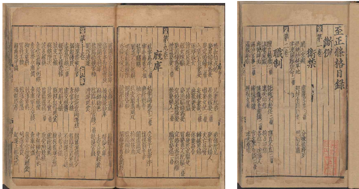
지정조격 권1~12, 23~34