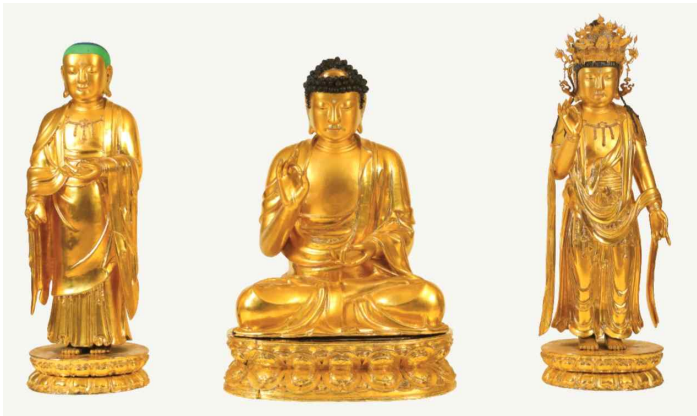
합천 해인사 원당암 목조아미타여래삼존상