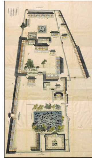
장용영 본영도형 일괄-기미본(1799년) *한국학중앙연구원 장서각