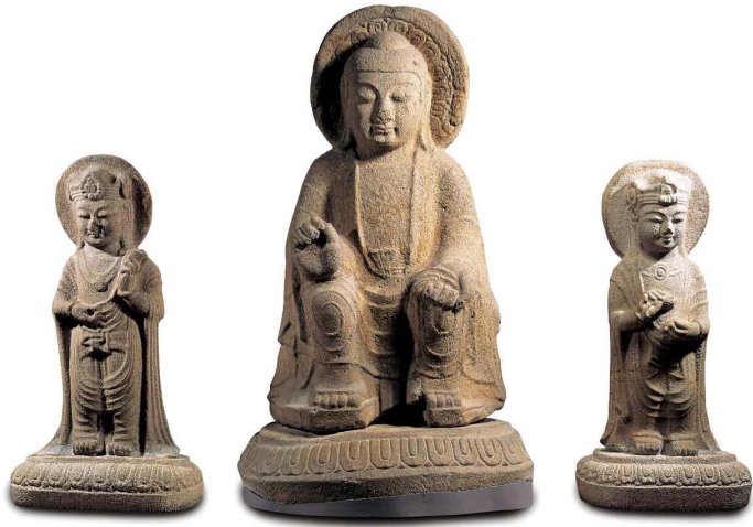
경주 남산 장창곡 석조미륵여래삼존상