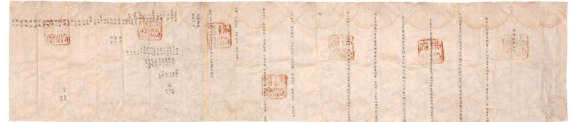
합천 해인사 원당암 목조아미타여래삼존상 복장유물(불상복장기문)