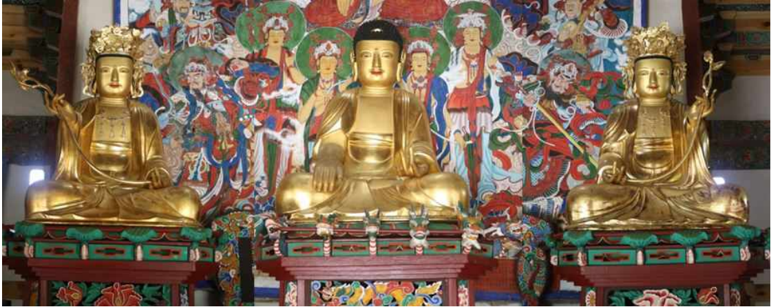
사진1. 진도 쌍계사 목조석가여래삼존좌상