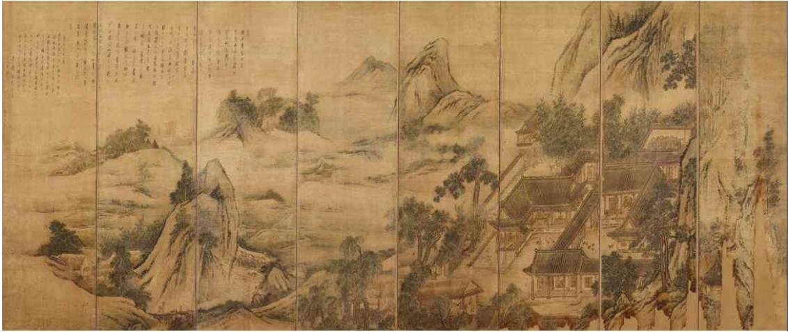
사진3. 김홍도 필 삼공불환도