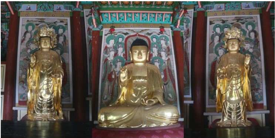
사진2. 대구 동화사 목조아미타여래삼존상