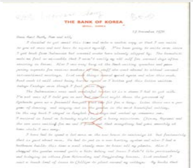
개인 서신 3(1972년)