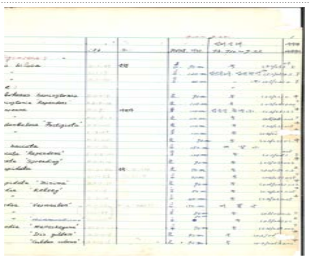
식물 관리 일지(1973년)