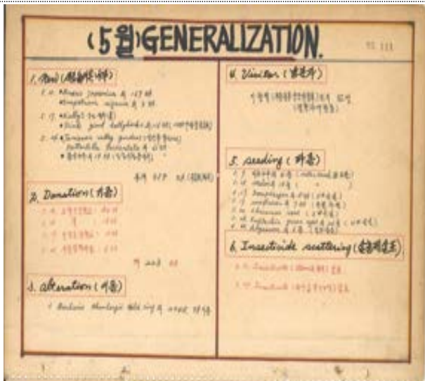
업무 일지 3권(1975년 5월)