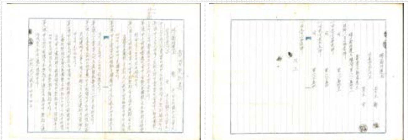
토지 매입 증서(1962년)