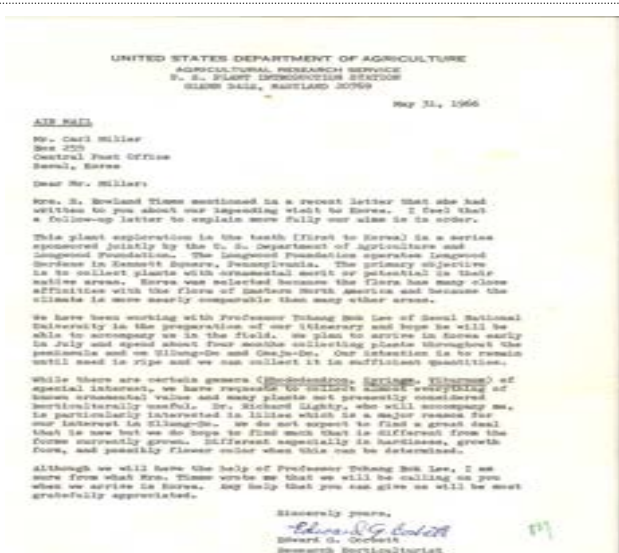
해외교류 서신 1(1966년)