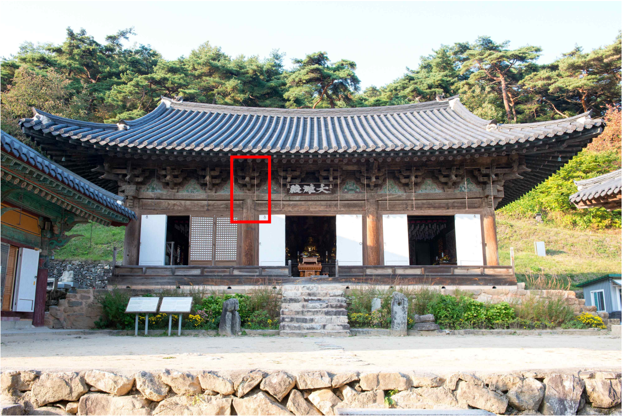
그림 1