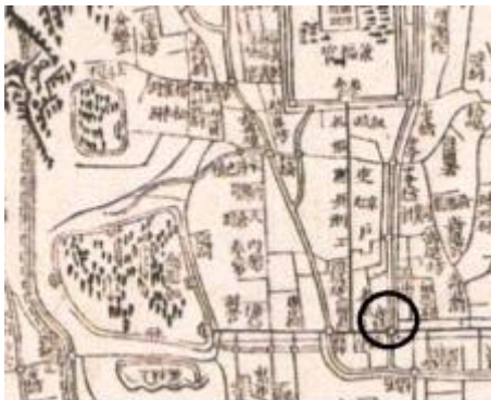
그림 1. 수선전도

수선전도에는 혜교(惠橋)라고 표시되어 있다(그림1). 또한 <경도오부북한산성부도>에는 이 다리를 세장교(歲長橋)라고 표기하였는데, 1926년 도로를 개수하면서 석교를 콘크리트교로 개수하고 이름을 복청교(福淸橋)라고 하였다. 1) 홍사용(洪思容, 1900~1947)시인의 1934년 4월 발표한 ‘호젓한 걸음’ 시 속에 복청교가 등장한다. 2) 현재 다리는 없어지고 교명주만이 남아있으며, 탑골공원 내에 보관되어 있다. 혜정교터의 표지석은 광화문우체국 앞에 위치한다(그림2).