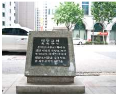
그림 2. 혜정교터 표지석

이 다리는 태종 12년(1412) 경상 · 전라 · 충청도의 역부를 동원하여 개천공사를 할 때 대광통교와 소광통교 등과 함께 만들어진 다리이다. 육조거리와 백성이 많이 모이는 종로거리와 마주치는 곳이며 우포청 앞에 위치한 곳으로 죄인에 대한 공개형 집행 장소로도 널리 알려져 있다. 또한 이곳 서쪽에는 세종 때부터 양부