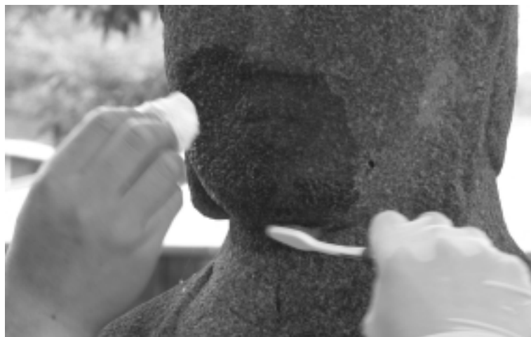
함안 대산리석불의 흑색오염물 제거과정