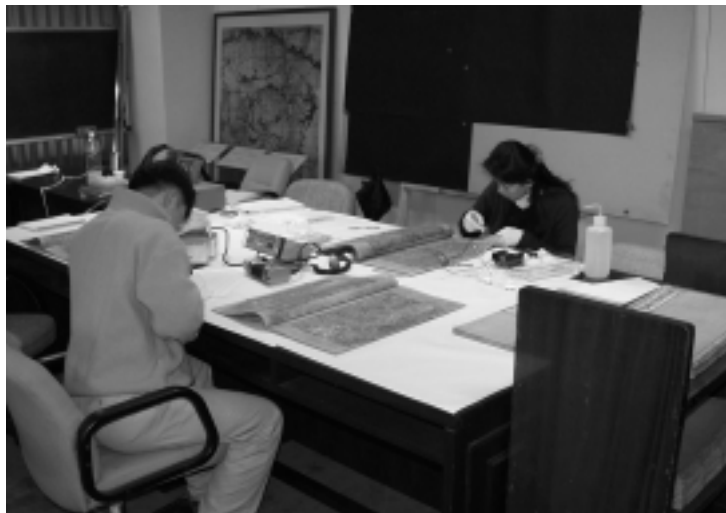
조선왕조실록 밀납본의 보존상태 조사모습 | - 지질의 두께 및 백색도·함수율 측정

2003년에는 실록 밀납본에 대한 손상상태 재조사 및 실록 보관 수장고에 대한 보존환경 조사를 실시하였으며, 황납과 백납을 이용하여 밀납지를 제조하였다. 또한 밀납지를 재현하기 위하여 다양한 환경 조건에서 인공경화 실험을 실시 중이다. 2004년에는 경화된 밀납지에 대한 물리·화학적 밀납 제거처리를 실시할 계획이며, 밀납 제거에 따른 지질의 안정성 및 배접 처리 등 실제 적용 여부에 대한 실험 연구를 통하여 실록 밀납본의 보존처리 방안을 수립하고자 한다.