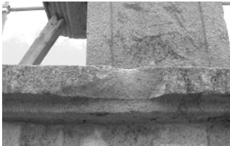
관덕동삼층석탑의 도기로 인한 갑석의 박락