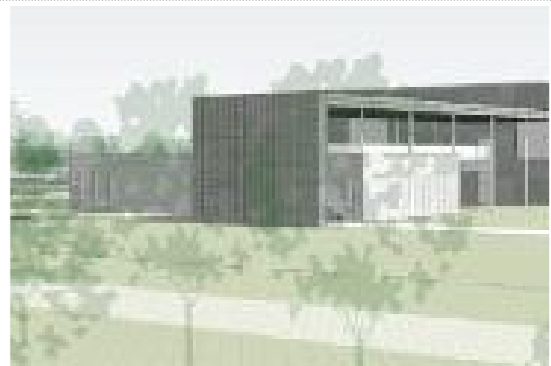
관리사무소(前 → 後)