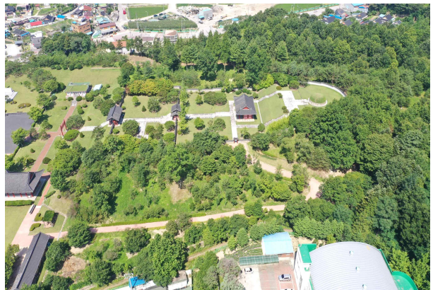
경외지역 관람환경개선 조경공사 前