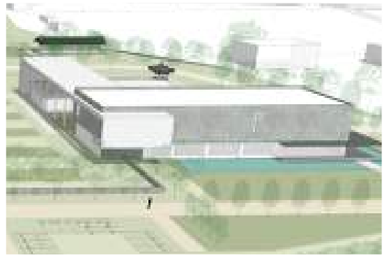
기념관(前 → 後)