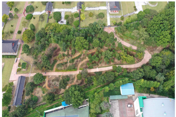
경외지역 관람환경개선 조경공사 後