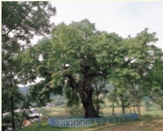
제305호 청원 강외면의 습나무 🍏