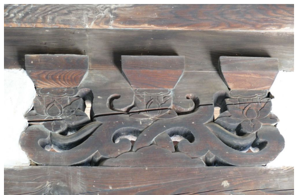
그림8. 화반 : 연화형 화반으로 투각한 조각기법 등이 고식이며 아름답음