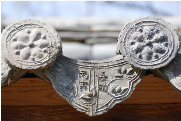
그림1. 가정(嘉靖) 연호가 새겨진 암막새 : 초창 때인 1566년에 제작된 기와로 문양으로 미루어 수막새도 초창 때 것으로 짐작된다.

야옹정은 1566년 권심언(權審言)이 선조인 야옹(野翁) 권의(權儀, 1475-1558)의 학덕을 추모하기 위해서 지은 정자이며 그 호를 따서 야옹정이라고 했다. 지붕 암막새 중에는 가정(嘉靖) 병인(丙寅)이라고 제작 년대가 새겨진 기와가 몇 남아 있다. 이 기록에 따르면 가정 병인년은 1566년으로 정자가 초창되었을 때 사용했던 기와이다. 막새를 통해 야옹정의 건립연대가 임진왜란 이전인 1566년이라는 것이 증명된다.