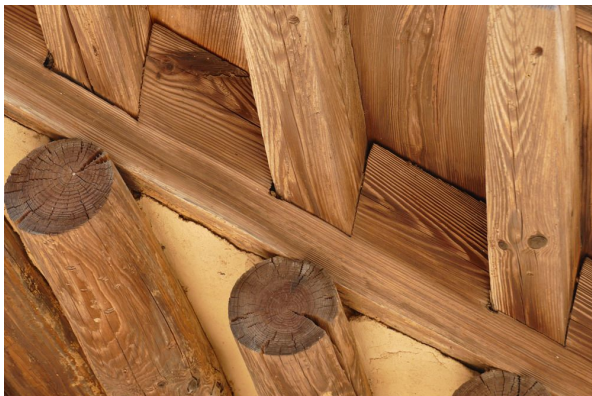
그림5. 구로대 사용 : 평고대와 착고판이 한 부재로 이루어진 고식 기법