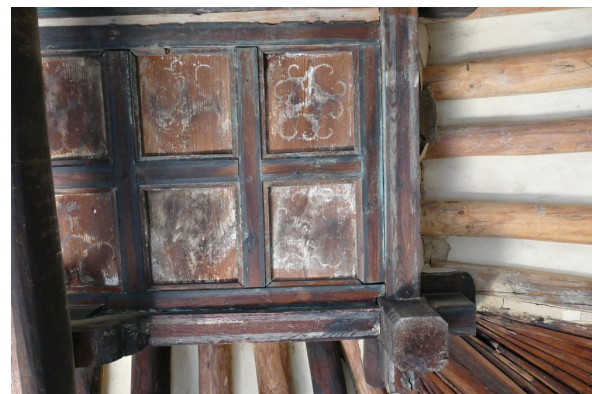
그림7. 눈썹천장 : 천장 개반에는 연화 단청이 고스란히 남아 있음