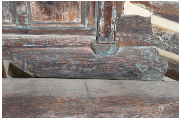
그림6. 대들보 위 동자주 익공 : 단청이 선명하게 남아 있음