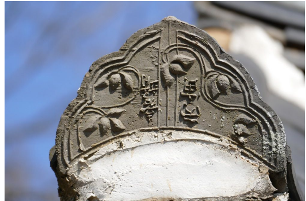
그림2. 가정(嘉靖) 연호가 새겨진 암막새를 뒤집어 망자로 사용하였다 : 연화로 추정은 되지만 보편적으로 볼 수 있는 문양은 아니다.