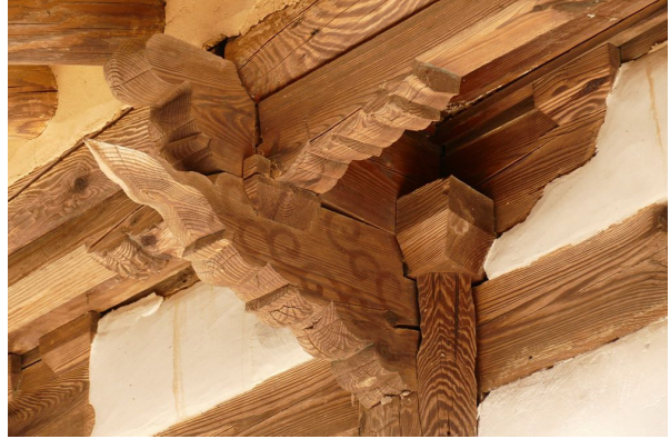
그림4. 야옹정 공포 : 3포 초익공형식으로 익공의 모습이 짧고 강직한 고식, 단청 흔적도 남음