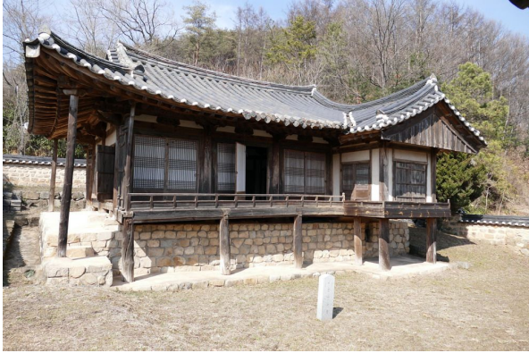
그림3. 야옹정 전경 : 6칸 대청과 남북 4칸의 방과 누마루의 구성

로대는 봉정사 극락전에도 있는 고식 기법으로 야옹정이 공포와 기법에서 고식이라는 것을 입증하고 있다. 화방은 연화형인데 투각하거나 고부조로 하여 입체감을 살렸는데 그 기법이 세련되고 아름답다. 지붕은 팔작지붕이고 누마루 빠진 곳은 맞배로 했으며 기와지붕이다.