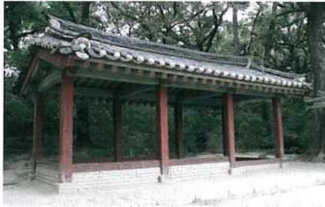
< 종묘 악공청 사진 >

형에 충족하지 않아도 되는 시설이라 생각한다. 더욱이 부장직소는 책임자의 관리 사무소인 것으로 생각되며 악공청은 종묘 악공청의 사례사진으로도 사직단 대문 부근에 설치하여도 사직단 운영관리에 커다란 영향이 없을 것으로 생각된다.