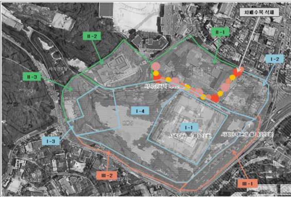
1. 사직단 권역별 복원정비 계획(안)