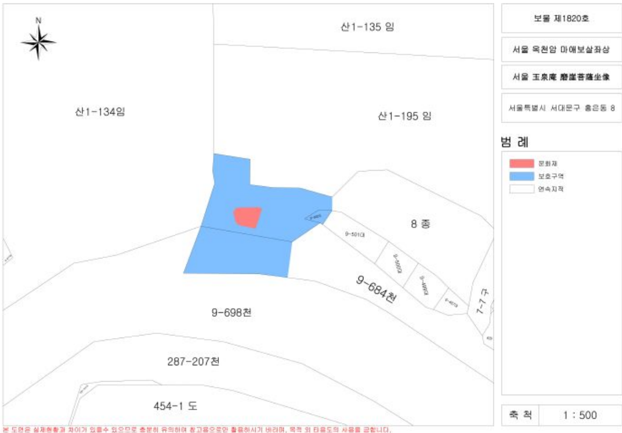
[붙임] 서울 옥천암 마애보살좌상 문화재(보호)구역