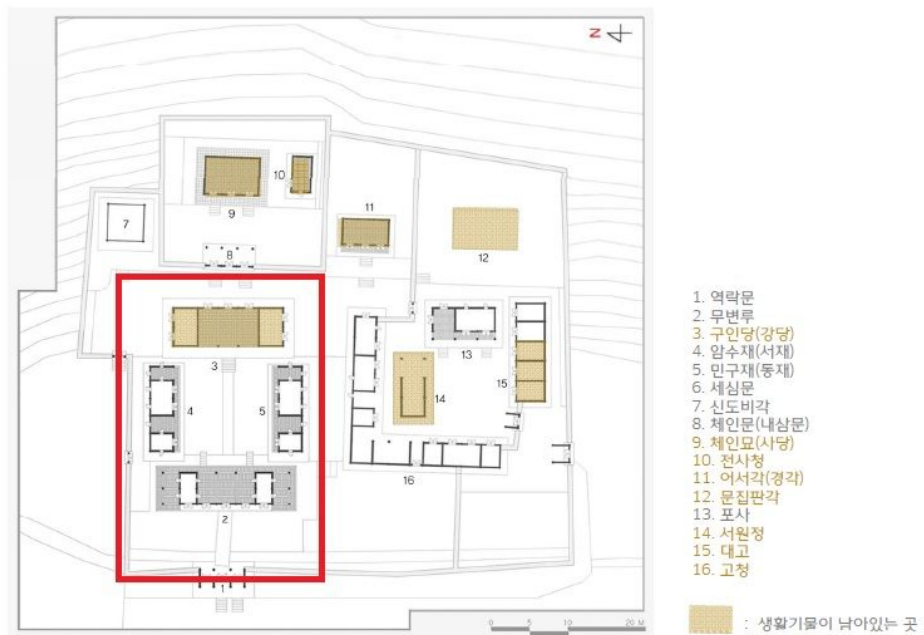
<옥산서원 내부구조> ※ 문화재 활용공간