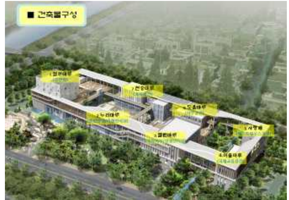
붙임 2. 국립무형유산원 조감도