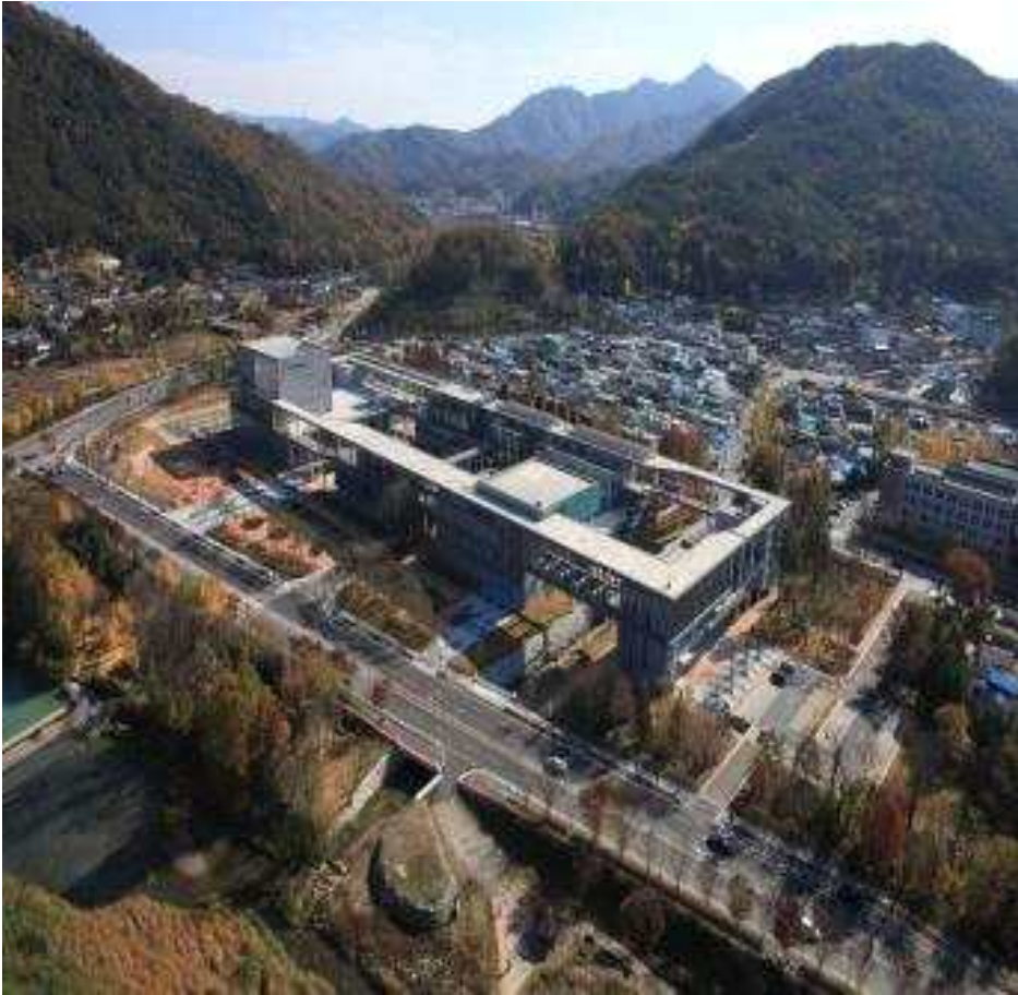
붙임 3. 국립무형유산원 실사사진